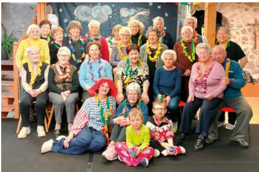
Il Gruppo Anziani nella sala Don Bosco