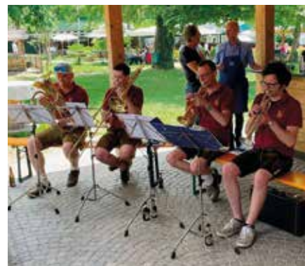
Il gruppo di fiati della Banda Musicale

Della ristorazione si è occupato un team di collaboratori volontari e di consiglieri comunali. Tra la polenta con il formaggio, salsiccia o bistecca di tacchino, nonché un dolce dessert, ciascuno dei numerosi ospiti ha potuto trovare qualcosa di suo gusto. Come accom-