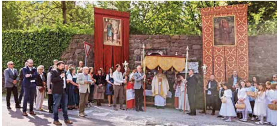
Die Bachprozession machte heuer an der restaurierten Gedenktafel halt