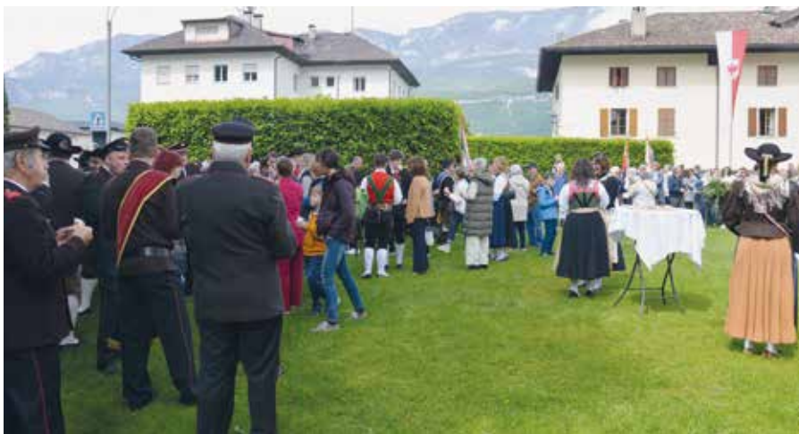
Un piacevole rinfresco dopo la celebrazione

li nelle singole parrocchie e nella comunità possano continuare a essere garantiti. Ha in seguito ringraziato tutti i partecipanti e gli ospiti per la buona riuscita della celebrazione e per aver trovato così numerosi la propria strada nella chiesa di Egna. Il rito di fondazione si è concluso con uno piccolo e corroboran-