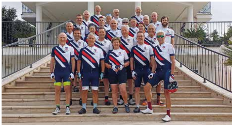
Mitglieder der Sektion Rad waren eine Woche lang am Bolsenasee

regio. Bis heute andauernde Erdbeben und Bergstürze drohen das kleine Dorf allmählich verschwinden zu lassen. Daher der Beinamen „das sterbende Dorf“.