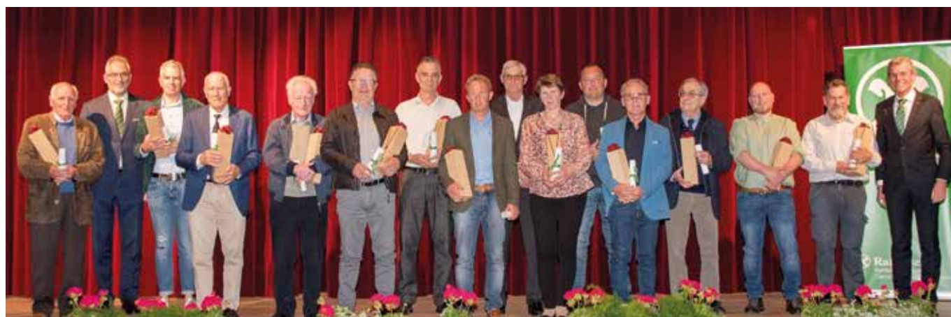
Mitgliederehrung - 25 Jahre