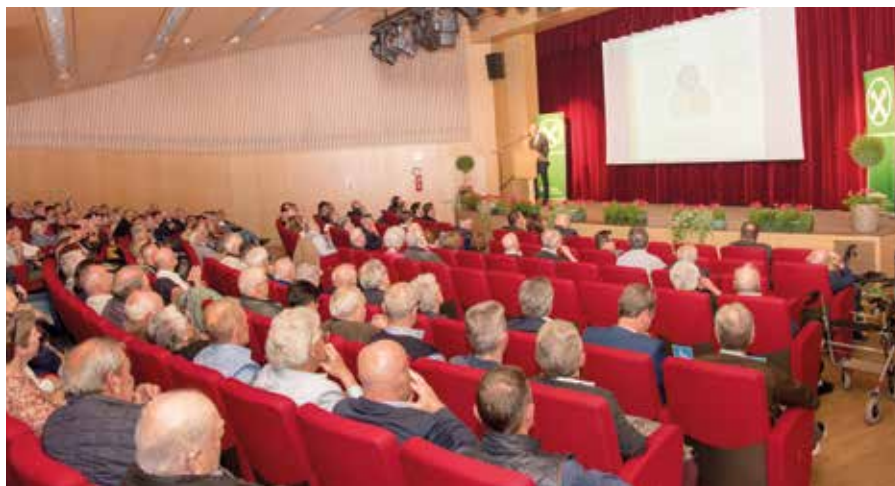
Quasi 300 soci hanno presenziato nell'Aula Magna di Laives

sostenuto interessi culturali, sport e associazioni economiche e sociali locali con donazioni e contributi per un totale di oltre 300.000 euro. “Un totale di 122 associazioni e organizzazioni dei vari comuni e gruppi politici della nostra area di attività hanno beneficiato di finanziamenti. In questo modo, adempiamo alla nostra responsabilità sociale e sottolineiamo il nostro particolare legame con il territorio e il nostro apprezzamento per il volontariato”, afferma il Presidente Zampieri.