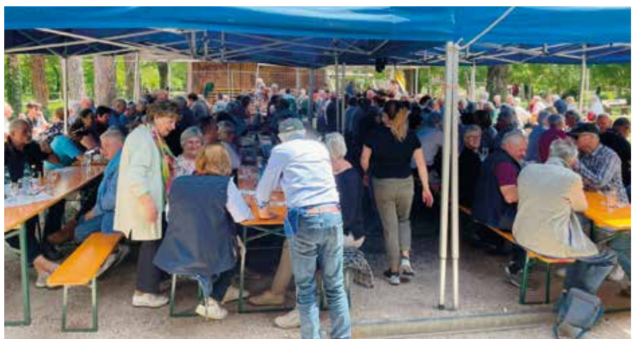
Das Seniorenfest war sehr gut besucht