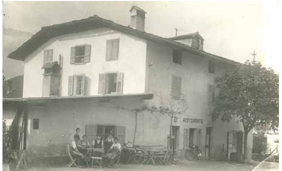
Ansicht des Hauses in der Fleimstalstraße mit Gasthaus und Geschäft in den 1940er-Jahren.