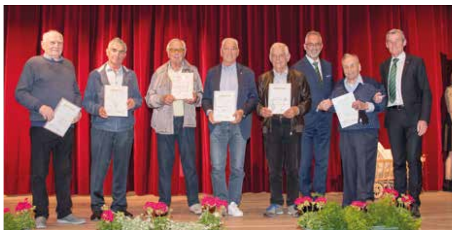
Mitgliederehrung - 50 Jahre

geschäftsvolumen auf 830 Millionen Euro weiter ausgebaut werden. Im Anlagebereich war eine sehr positive Entwicklung feststell-