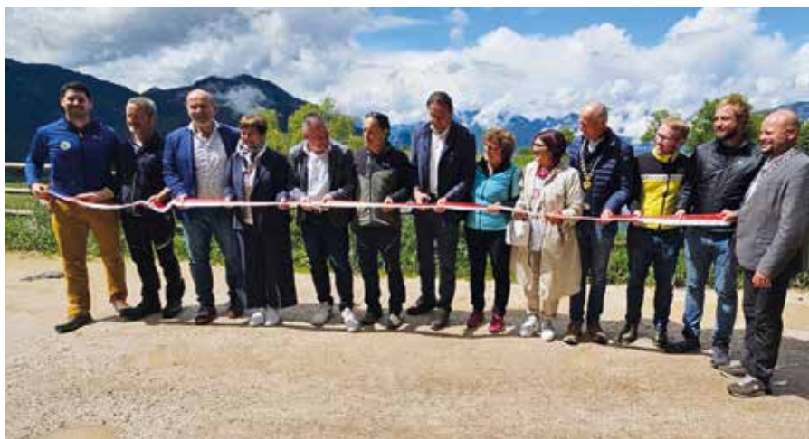
Die Eröffnung des Schwarz - Weiß Weges fand mit der traditionellen Banddurchschneidung statt

Der Weg selbst ist in zwei Routen unterteilt: die schwarze Route, die zum Schwarzhorn führt, und die weiße Route, die Wanderer in Richtung Weißhorn leitet. Diese beiden Rou-