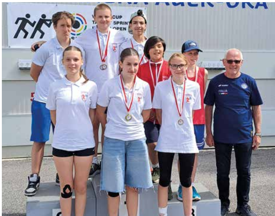
Die jungen Aurer Athleten im Target Sprint

Zum Schluss waren sich wohl alle – Athleten, Betreuer, sowie alle Anwesenden einig: Diese spannende und attraktive Sportart begeistert jeden und hat sicherlich Zukunft. Alle die sich einmal ein Training unserer Athleten anschauen wollen oder gleich selbst