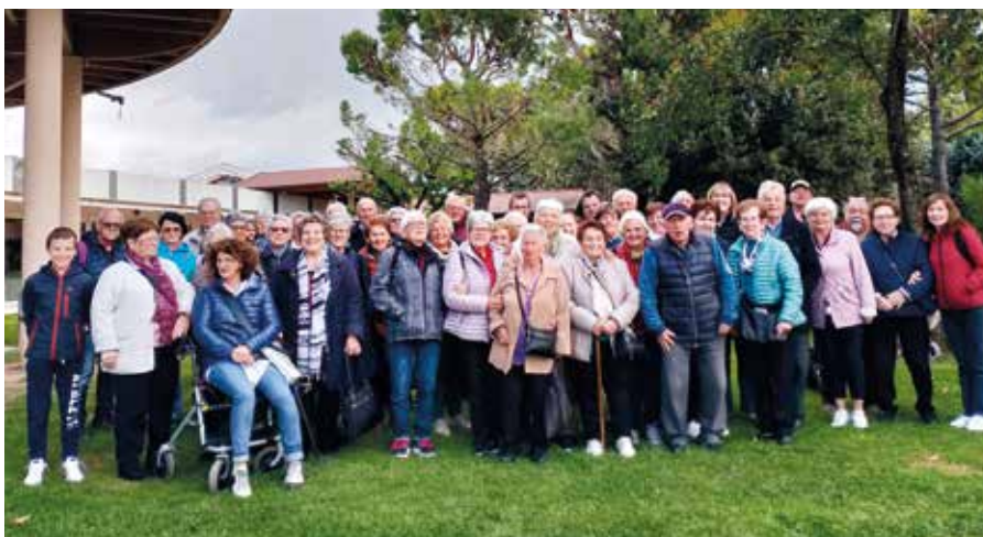
Gita del Gruppo Anziani