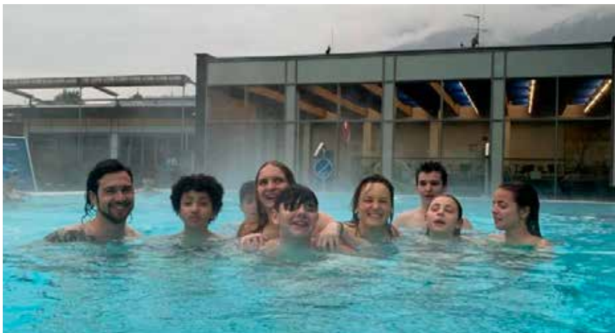
Unser Team mit einigen Jugendlichen im Acquarena

Es wird auch für uns Jugendarbeiter*innen ruhiger und wir freuen uns, dass wir auch wieder das ein oder andere Fußballspiel im frühlingshaften Oberdorf, abhalten können und generell mehr Aktivitäten an der frischen Luft anbieten können. Seit Februar versuchen wir auch allmonatlich, einen Ausflug für die Jugendlichen anzubieten so verschlug es uns am 1. März ins Acquarena nach Brixen. Die Daten für die nächsten Ausflüge sind Freitag, der 5. April und Freitag der 3. Mai . Kaum kommt der Frühling, startet auch die Planung für den Markusmarkt. Nach dem Erfolg der letzten Jahre, werden wir auch dieses Jahr mit dem Kulturverein Hospiz zusammenarbeiten. Wie 2023 werden wir erneut auf dem Skatepark unseren Standpunkt haben. Neben Getränken und Musik kann man auch die ein