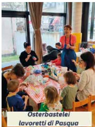
Osterbastelei lavoretti di Pasqua