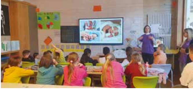
Una lezione ricca di emozioni sul difficile percorso dei bambini prematuri