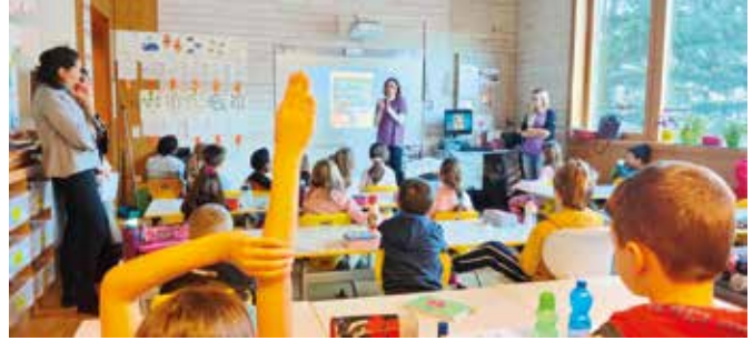
Tanto interesse e curiosità tra gli alunni

bicini inseriti nel loro nasino. È stato toccante scoprire il valore di queste azioni che garantiscono il benessere dei piccoli pazienti e un aiuto alle loro famiglie.