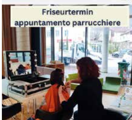
Friseurtermin appuntamento parrucchiere