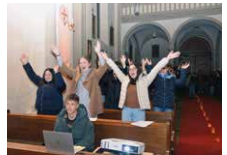
Soundandacht in Montan

Dann teilte sich die Gruppe. Die Firmlinge, die am 21. April das Sakrament der Firmung empfangen, setzten sich mit ihrem Firmspender