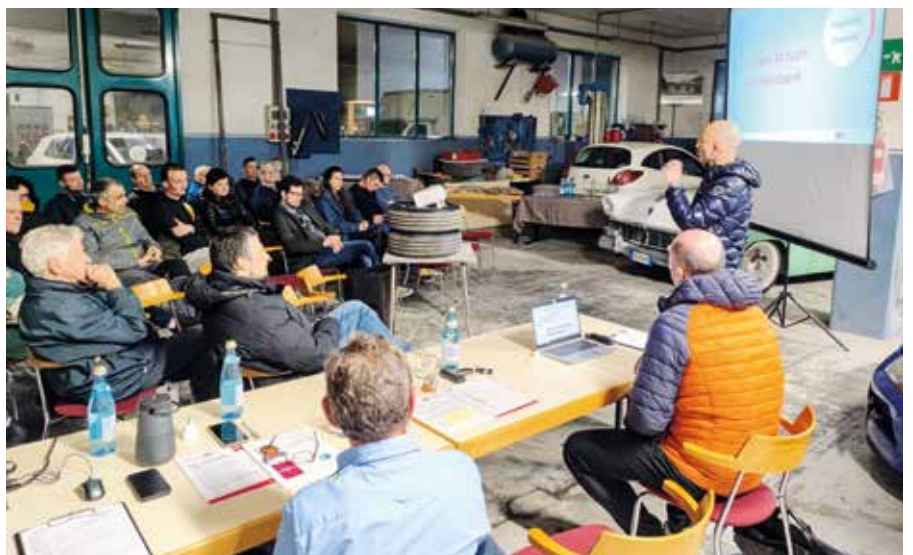
Zahlreiche Teilnehmer/innen bei der Ortsversammlung in Auer

Zu den Höhepunkten im letzten Jahr gehörte der „Lange Dienstag“, bei dem eine spezielle Werkstatt für Kinder eingerichtet wurde. „Hier konnten die Teilnehmerinnen und Teilnehmer Einblicke in die Berufswelt erhalten und hatten die Möglichkeit, selbst Hand anzulegen. Das Ganze giftelte in einer beeindruckenden