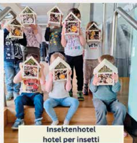
Insektenhotel hotel per insetti

in Ausarbeitung, diese teilen wir euch so bald wie möglich mit.