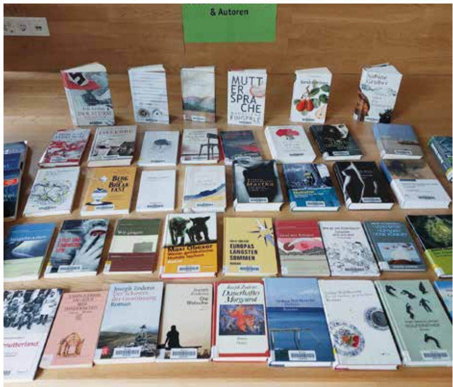
Südtiroler Autoren und Autorinnen