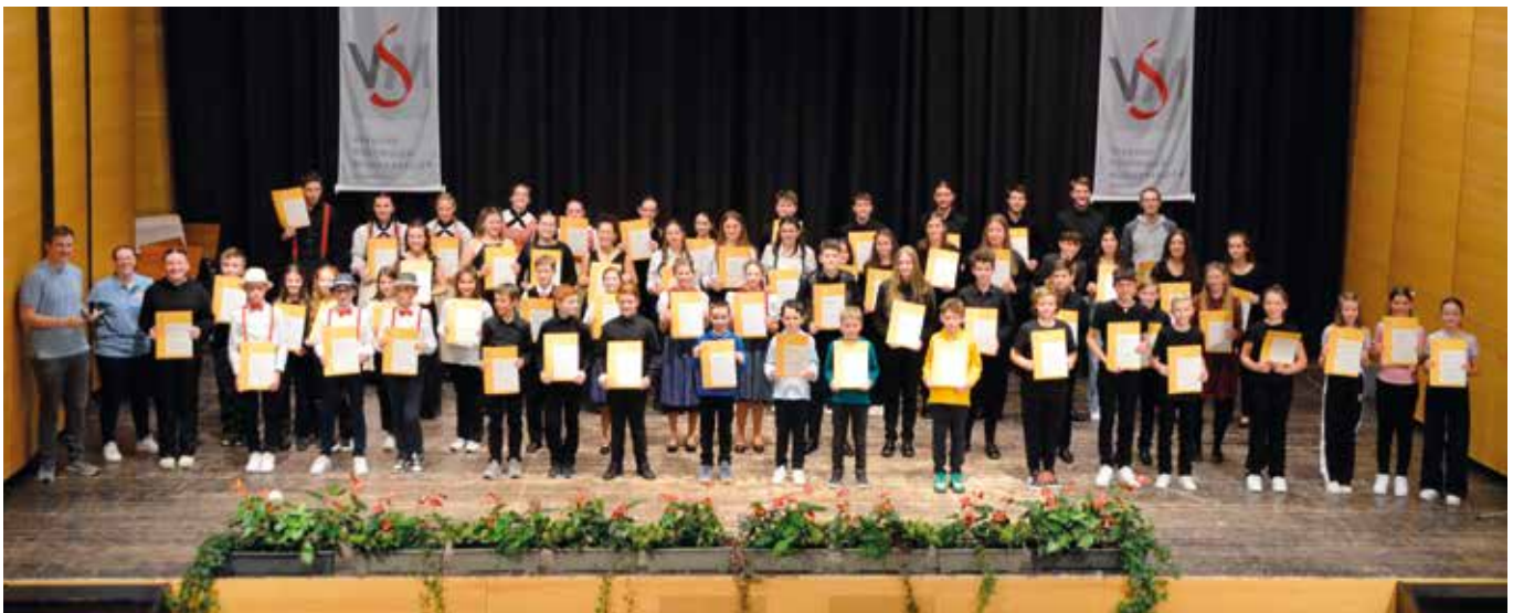
Im März fand der 14. Südtiroler Landeswettbewerb „Musik in kleinen Gruppen“ in der Aula Magna in Auer statt. 26 verschiedene Ensembles stellten sich der Fachjury und überzeugten mit tollen Leistungen.