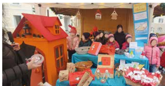
Il consueto Mercatino di Natale è stato un grande successo