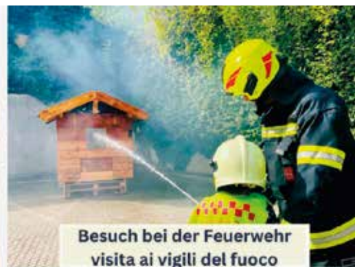
Besuch bei der Feuerwehr visita ai vigili del fuoco