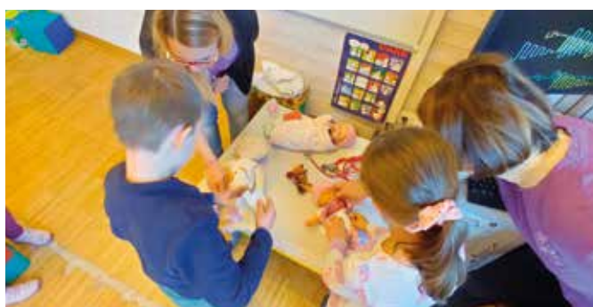
I bambini si divertono a cambiare il pannolino alle piccole bambole

ciazione Prematuri Alto Adige si impegna ad agevolare le cure intensive e specializzate ai neonati prematuri e sostenere le loro famiglie. Le attività svolte da medici e infermiere includono l'utilizzo di incubatrici, apparecchiature specializzate che forniscono un ambiente controllato e protetto in cui i neonati possono crescere e svilupparsi. Queste mantengono una temperatura costante e regolabile, proteggendo i neonati prematuri dal freddo eccessivo e dall'ambiente esterno. Inoltre, forniscono un'atmosfera sterile per ridurre il rischio di infezioni e altre complicazioni. Per fornire l'alimentazione frequente di cui i neonati hanno bisogno, le infermiere si turnano giorno e notte e alle volte è necessario collegare i piccoli ad una sacca di cibo tramite tu-