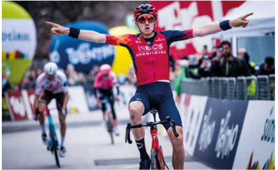
Tour of the Alps

Auf dem St. Martin Platz wird von 13 bis 16 Uhr die Musik der örtlichen Böhmischen der „Kurtiniger Böhmischen“ die richtige Feststimmung schaffen, während die Anwesen-