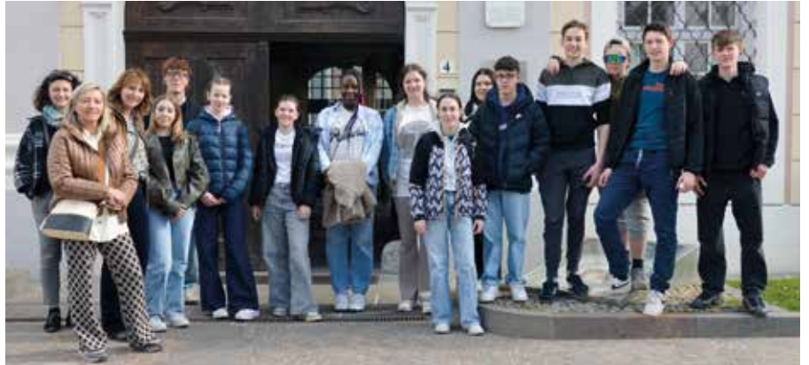
Die Firmgruppe in Brixen

Mit dem Besuch der Soundandacht am 1. März in Montan, welche vom Jugenddienst Unterland organisiert wurde, ging die Firmvorbereitung im Frühjahr weiter. Wir durften dort eine Form von Andacht kennenlernen, die von Jugendlichen gestaltet und geleitet wurde. Auch Firmlinge aus unserer Gruppe waren bei den Vorbereitungen fleißig dabei und gestalteten den Abend aktiv mit.