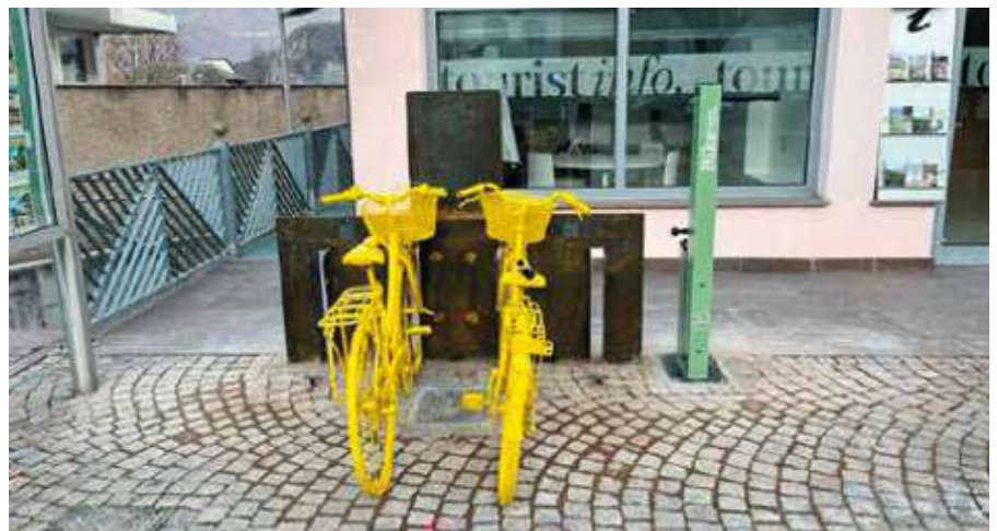
Die E-Bike Ladestation am Hauptplatz