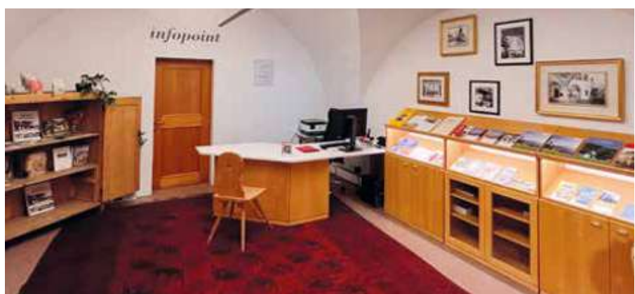
L'ufficio turistico ad Egna

Un caloroso ringraziamento va naturalmente alle nostre imprese artigiane locali, senza le quali un progetto del genere non sarebbe stato possibile: