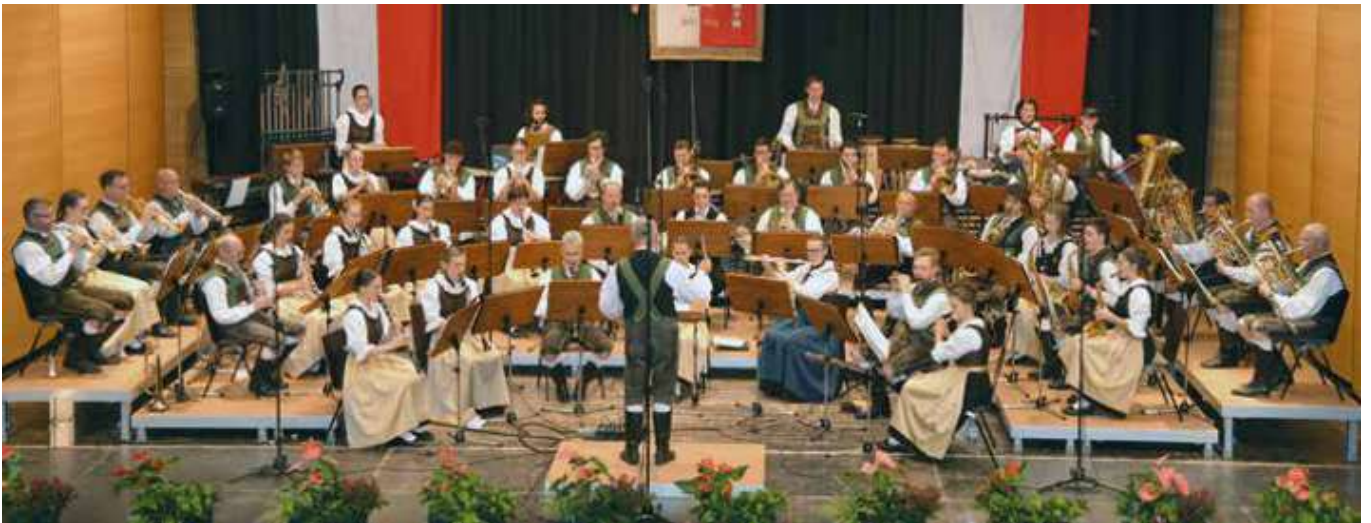
Die Musikkapelle beim Cäcilienkonzert

Am 18. November fand das Cäcilienkonzert der Musikkapelle Auer statt.