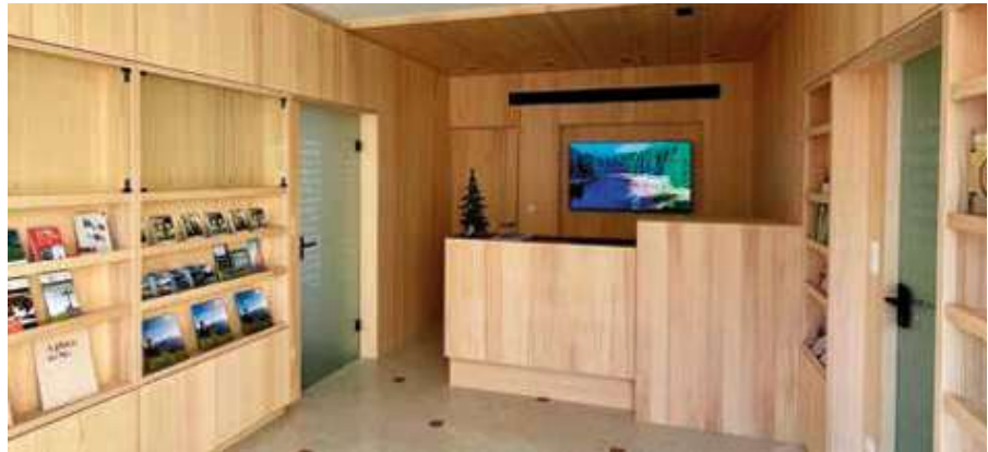
Das neu gestaltete Tourismusbüro in Auer

Dank gebührt natürlich unseren lokalen Handwerksbetrieben, ohne die ein solches Projekt nicht möglich gewesen wäre: