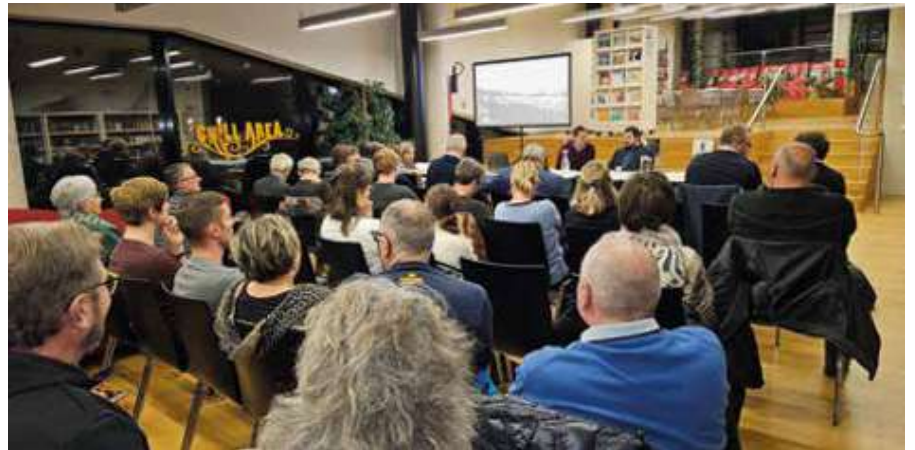
Die Auftaktveranstaltung zum Gemeindeentwicklungsprogramm

Bei der Auftaktveranstaltung nahmen neben dem Projektkoordinator und Fachplaner für