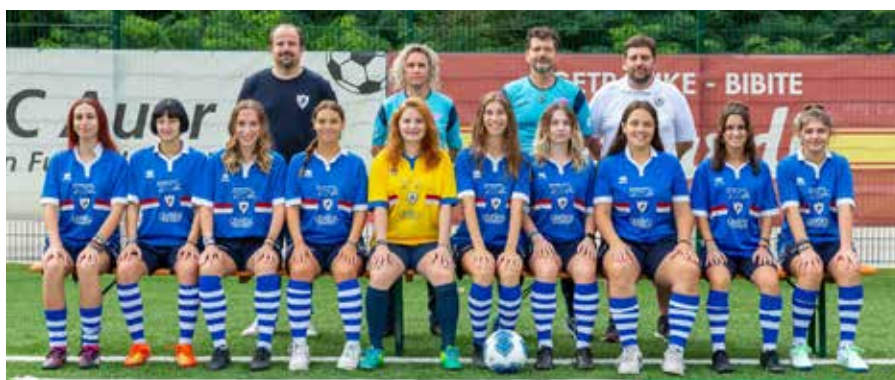
Ladies Kleinfeld - Calcio a 5 femminile Juniores