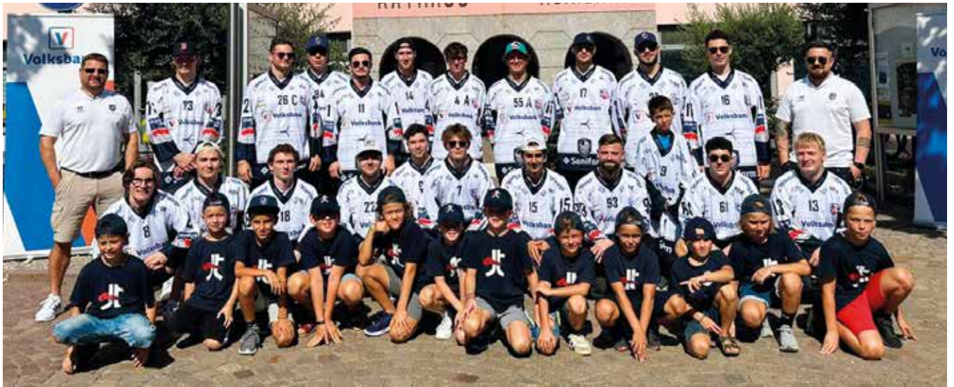
Die Mannschaft Hockey Unterland Cavaliers. In der ersten Reihe Jugendspieler der Juniorteams

Bei strahlend blauem Himmel wurden die Spieler der Hockey Unterland Cavaliers Bacio della Luna im Rahmen eines Frühschoppens der Öffentlichkeit vorgestellt.