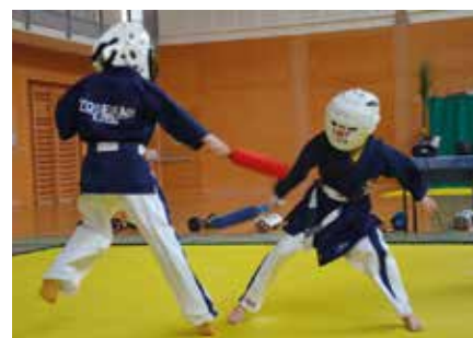
Kämpfen und sich messen macht den Jungen Spaß

Informationen: Tel. 339 46 83 245 oder morandellbrigitte@gmail.com online-Anmeldung: www.yoseikan-budo-auer.it