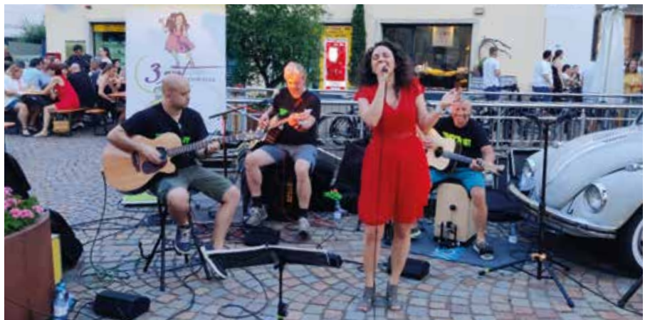
Jeden Dienstag wurde Musik dargeboten

willige Feuerwehr. Von den Geschäften beteiligten sich Mode Zen und Procurso.