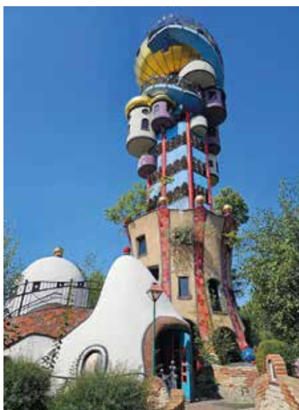
Der Kuchlbauer Turm entworfen und gestaltet von Friedensreich Hundertwasser

Elemente von Hundertwassers menschengerechterem Bauen im Einklang mit der Natur. Auf der Heimfahrt waren sich die Teilnehmer einig, es war ein Ausflug, bei dem die Kultur im Mittelpunkt stand, das Gesellige aber keinesfalls zu kurz kam.