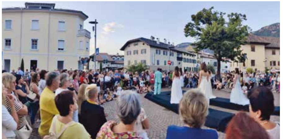
Die Modeschau fand großen Anklang

Gastronomiebetriebe und verschiedene Auer Vereine tischten allerlei Köstlichkeiten aus der traditionellen und internationalen Küche auf. Mit dabei waren an den vier Abenden die Gasthäuser Bar Rosenkeller, Bar Maurice, Gasthaus Waldthaler, Bistro Basilicum, Hotel Elefant, Oenoteque Cristal und das Café Visintin. Zahlreiche Vereine haben kulinarische Spezialitäten angeboten und ein buntes Rahmenprogramm für Jung und Alt geliefert. Zu den teilnehmenden Vereinen zählten heuer: Elki, Alpini, Asc Tennis, Sportschützen, Katholische Frauenbewegung, Jugend Cultura Unterland, öffentliche Bibliothek, Aurora Dance, LVH, LC Kaltern & VSS, Eiskunstlauf, Südtiroler Bauernjugend, Eisstockschiützen, Schützenkompanie, die Bäuerinnenorganisation, der Katholische Familienverband, die Musikapelle, ASC Auer Fußball und die Freiwillige Feuerwehr. Von den Geschäften beteiligten sich Mode Zen und Procurso.