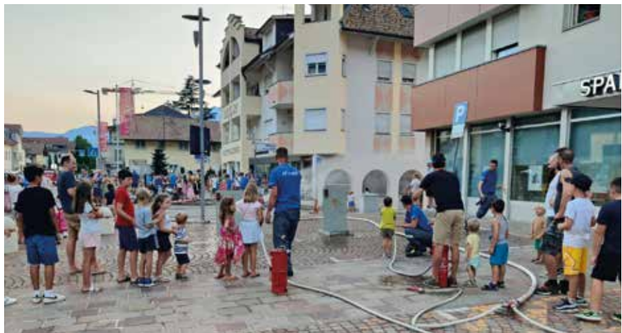
Die Feuerwehr begeisterte die Kleinsten

Ohne die Unterstützung zahlreicher Sponsoren wäre die Organisation der vier Abende nicht in dieser Form möglich gewesen.