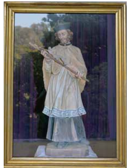
Abbild des hl. Johannes Nepomuk

Die vom Verschönerungsverein renovierte Johannesstatue ist wie bekannt gestohlen worden. Nun steht in derselben Nische, ein