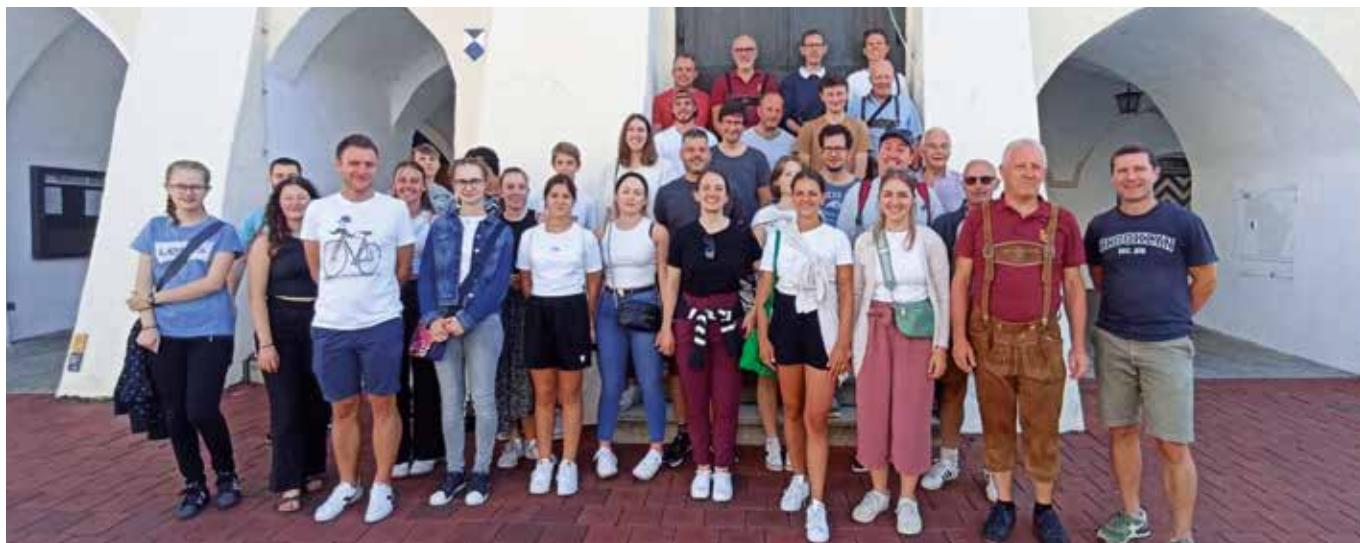
Die Musikkapelle in Mühldorf

Nach langer Zeit organisierte die Musikkapelle Auer im heurigen Sommer wieder eine Auslandsfahrt nach Deutschland.