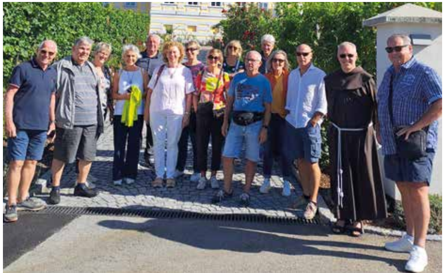
Der Jahrgang 1957 in der Wachau

Am nächsten Tag stand eine Besichtigung mit Führung in der allseits bekannten Winzerver-