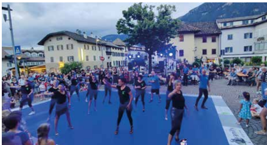
La danza ha emozionato il pubblico

ta in casa. All'intrattenimento musicale hanno pensato i gruppi musicali e DJ "3 Guat und 2 Schianere", DJ Marian, DJ Robl, Simon Feichter, DJ Reverend Chrissy, DJ BM e la banda musicale di Ora.