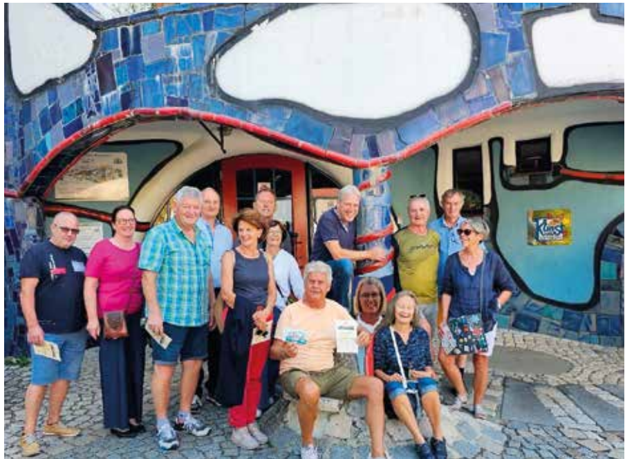
Der Jahrgang 1958 vor dem Kunsthaus

Am Sonntag zog in Abensberg die Brauerei Kuchlbauer, die Bier und Kunst in Einklang gebracht hat, die Besucher in seinen Bann. Am Eingang zur Brauerei steht das Kunsthaus, das zusammen mit dem schiefen Turm dem Leben und Werk Friedensreich Hundertwasser gewidmet ist. Bei einer Führung beeindruckte nicht nur die Braukunst, sondern ganz besonders das wohl letzte Bauwerk des berühm-