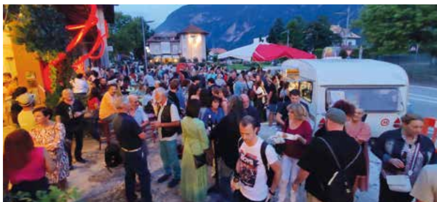
Grande afflusso alla manifestazione

Il comitato di formazione permanente di Ora, su incarico del Comune, ha redatto un concept con una chiara visione: AurOra dovrebbe rappresentare un centro culturale sovracomunale, in grado di rafforzare la vita socio-culturale della parte sud dell'Alto Adige. L'obiettivo è quello di creare un luogo in cui possano trovare spazio attività per tutte le diverse fasce di età e i diversi gruppi linguistici.