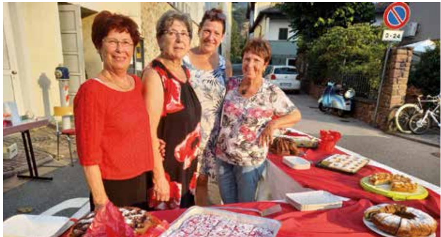
Die Katholische Frauenbewegung kredenzt Kuchen und Torten

Die vorläufigen Termine für die Langen Diensstage im kommenden Jahr sind: 9. und 23. Juli, 6. und 20. August 2024.