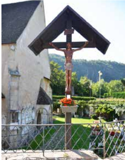
Die Christusfigur wurde restauriert

Der Verschönerungsverein Auer hat das Kreuz am Friedhof neben dem hl. Freinademetz-Bildstöckl renovieren lassen.