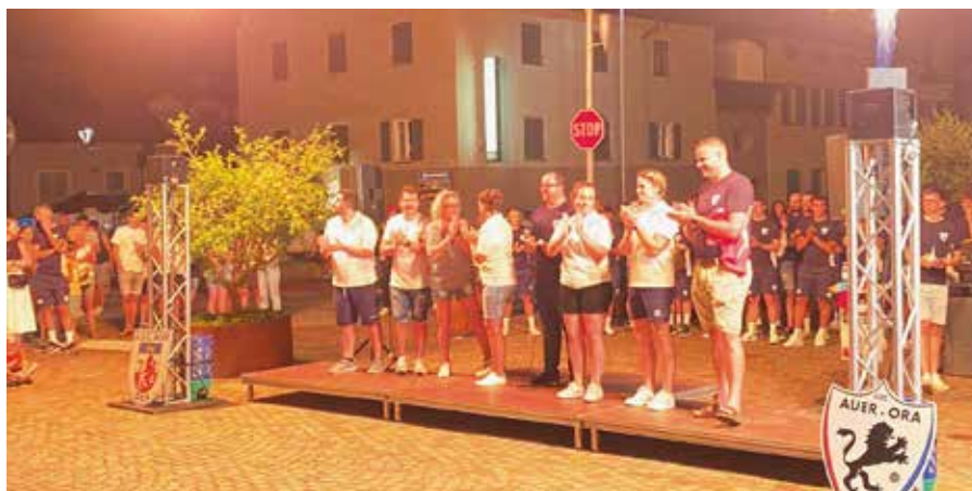
Presentazione della Prima Squadra di calcio