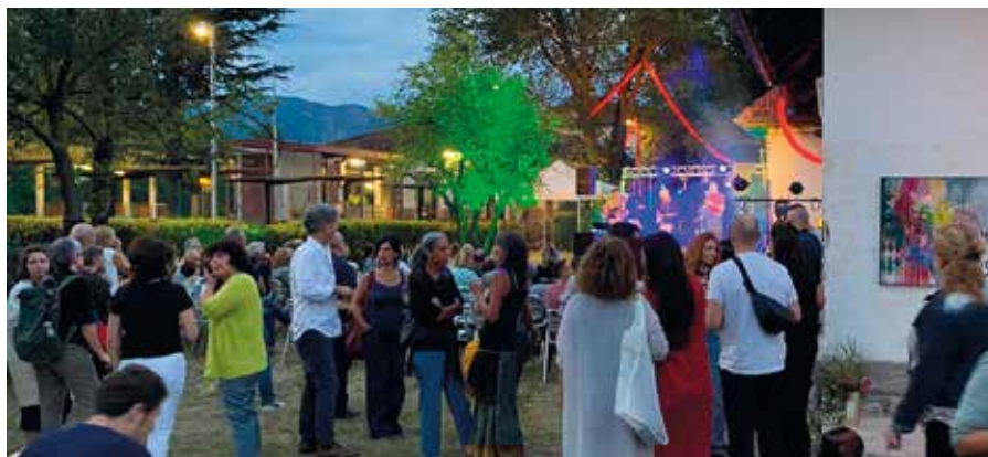
Musik vieler Stilrichtungen wurde gespielt