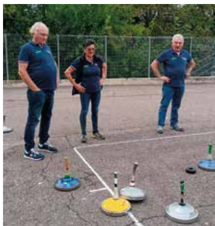
Im Sommer wird auf Asphalt geschossen