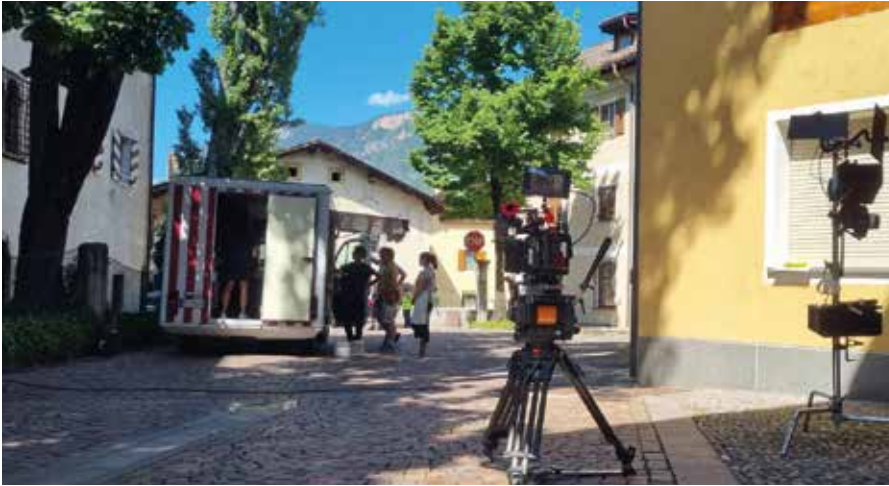
Am Kirchplatz wurde eine Woche lang für die ARD-Serie Bozen Krimi gedreht

Die Pilotfolge wurde am 29. Januar 2015 ausgestrahlt. Bisher sind 18 Episoden veröffentlicht worden. Die in Auer am Kirchplatz gedrehten Szenen werden voraussichtlich in Folge 19 oder 20 zu sehen sein.