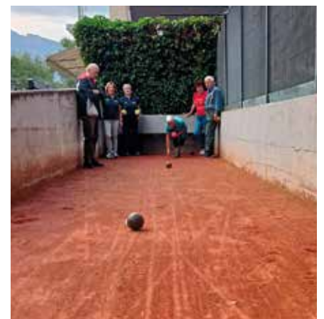
Training auf der Bocciabahn im Schwarzenbach