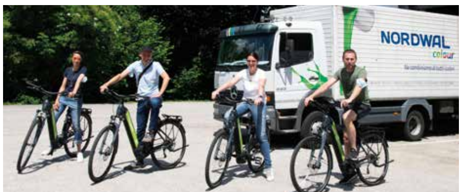
Wir radeln mit Nordwal

Danke oftmals! Der neue Radweg soll ein sportlicher Ansporn für alle unsere Anrainer sein, mit dem Fahrrad in die Firma zu kommen oder sich bei uns die Firma eigenen E-Bikes auszuleihen und mit Spaß in die Mittagspause zu radeln.