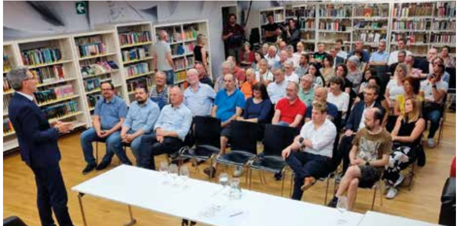
Bürgerversammlung mit Landeshauptmann Arno Kompatscher

Die Gemeinde Auer hatte sich vor mehr als einem Jahr um Gelder aus dem PNRR Wiederaufbaufond beworben, um einen neuen, für das Dorf angemessenen Recyclinghof zu bau-