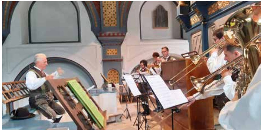
Ein Bläsersextett wirkte bei der Hochzeitsmesse mit

Die Bläserstage in Grissian, die normalerweise den Mitgliedern der Jugendkapelle vorbehalten sind, werden dieses Mal ein wenig anders ablaufen. Da wir in den letzten Jahren auch coronabedingt nicht auf die Hütte gehen konnten, sind dieses Jahr alle Mitglieder der Musikkapelle, egal ob jung oder alt, herzlich dazu eingeladen das erste Wochenende im August in Grissian zu verbringen. Natürlich wird viel musiziert werden, besonders in kleinen Gruppen, aber auch das Gesellige wird dabei sicherlich nicht zu kurz kommen!