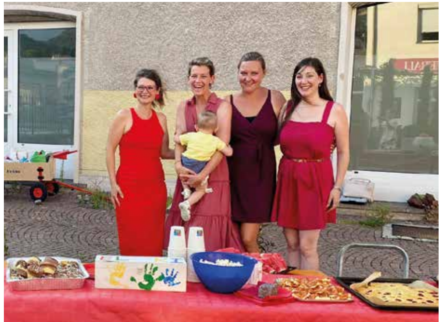
Das Elki setzte rote Akzente beim Langen Dienstag

ueberetsch-unterland/auer/ und unserer Facebook Seite!