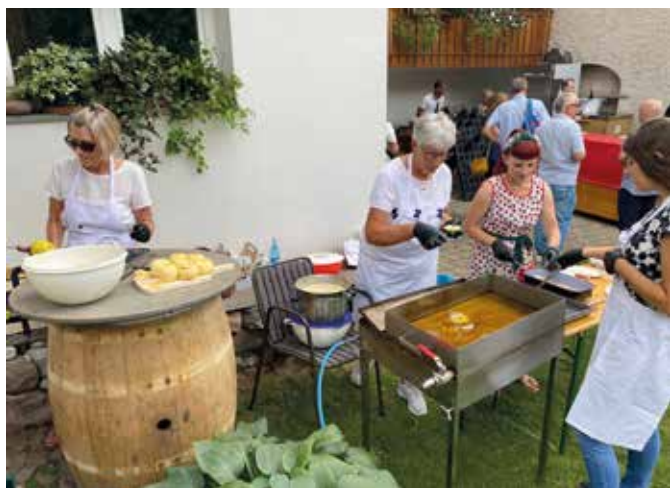
Fleißige Hände bei der Apfelkiachel-Produktion vor Ort.