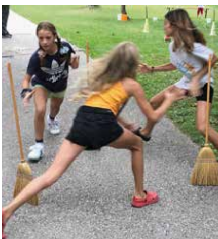
È richiesta una buona agilità