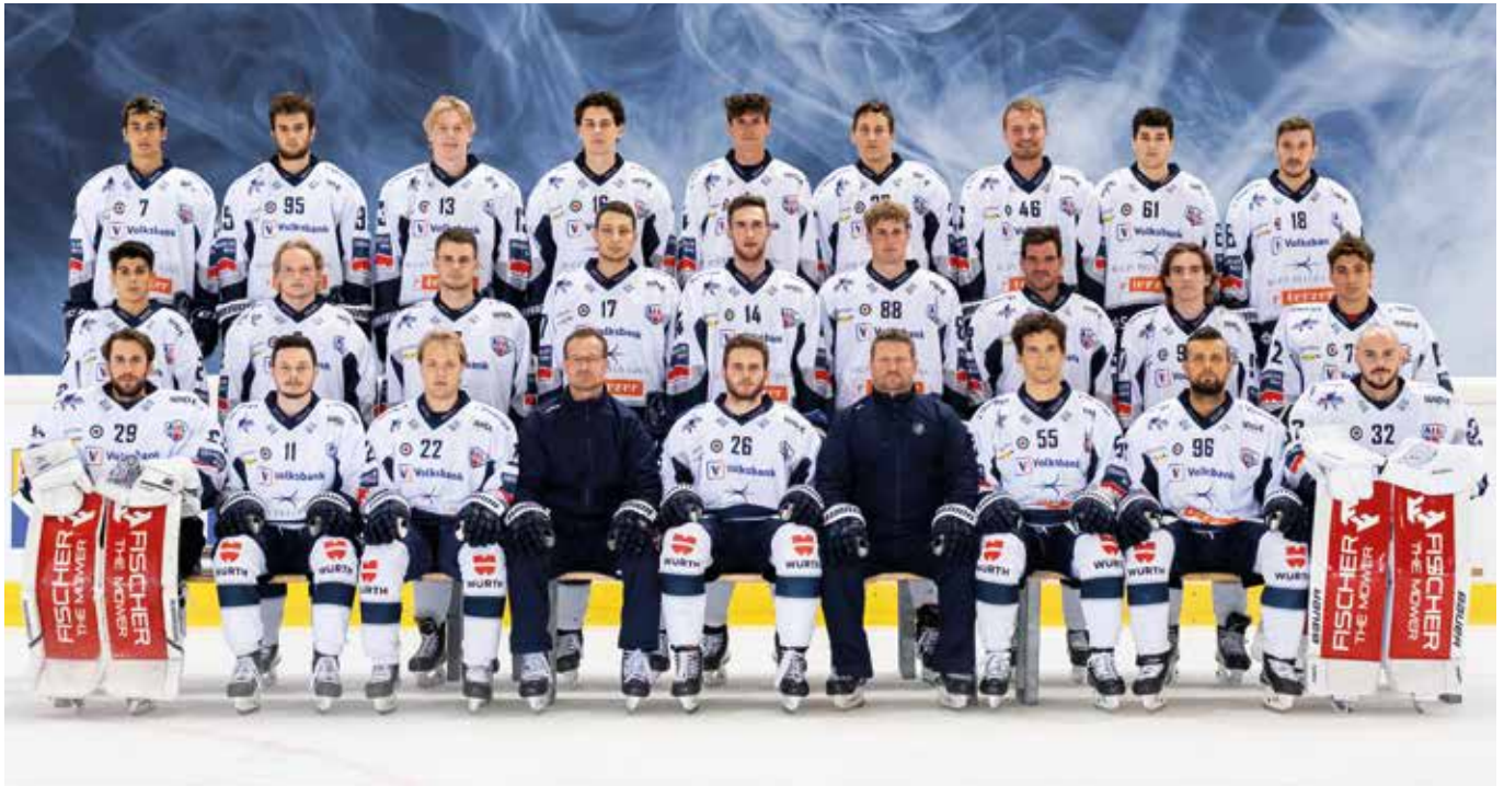
Die Hockeymannschaft HC Unterland Cavaliers