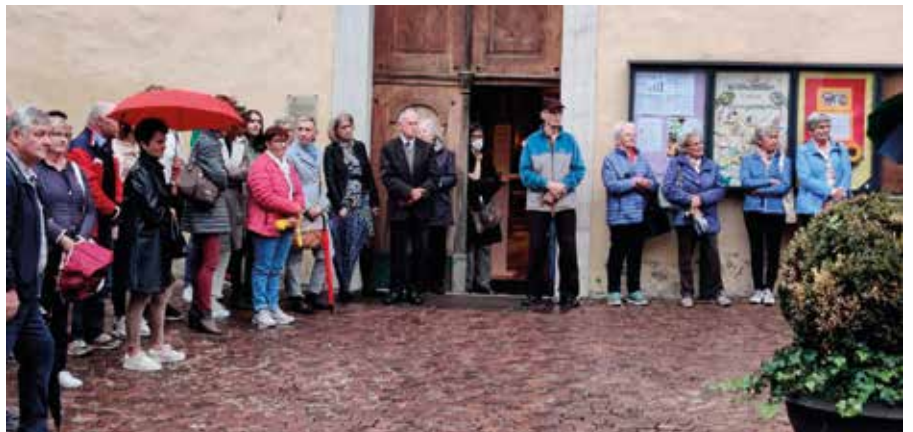
Nach dem Gottesdienst gratulierte auch die Bevölkerung zum 100. Geburtstag