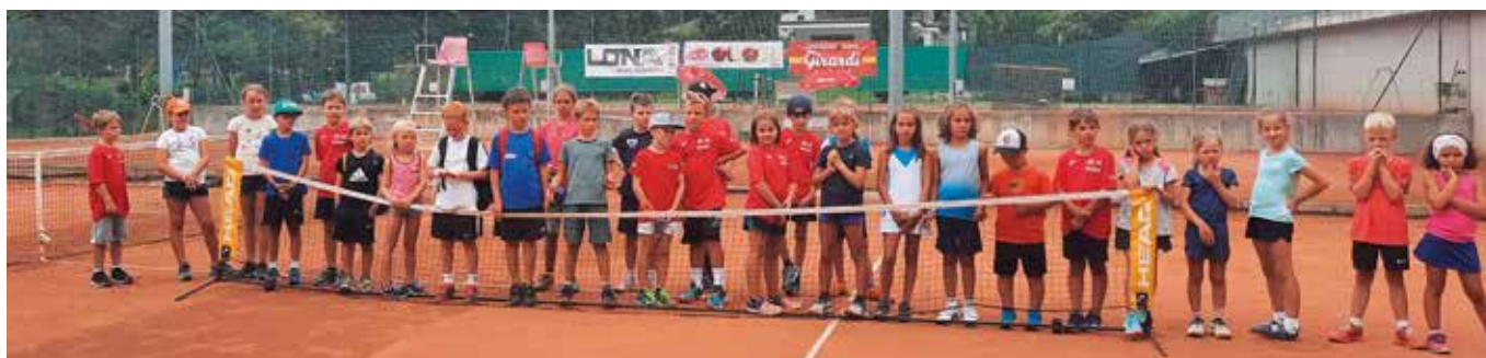
Il tennis ripende slancio