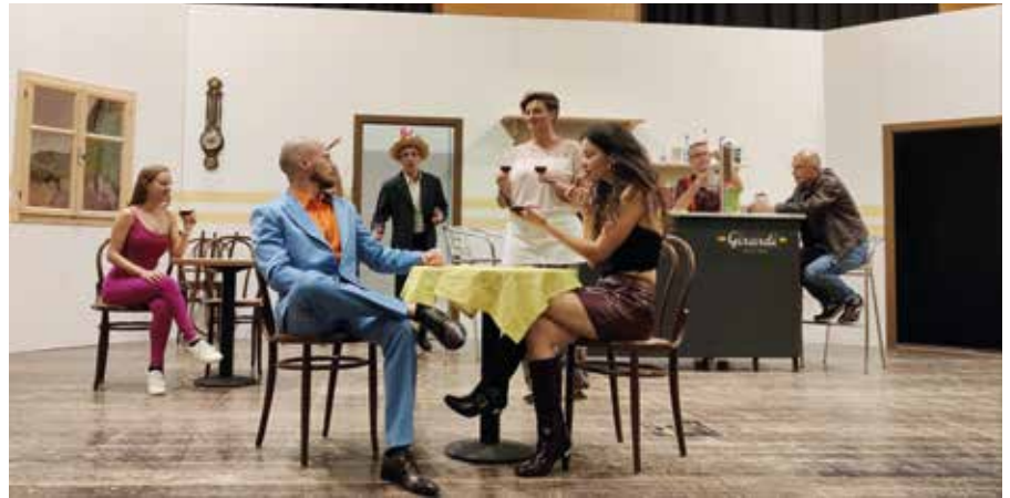
Die Heimatbühne bringt das Stück Currywurst Deluxe zur Aufführung