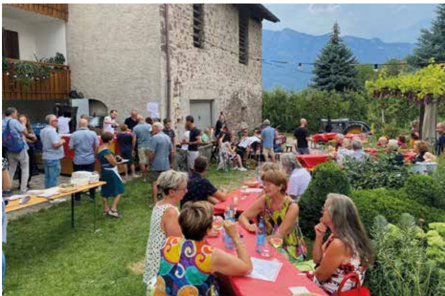
Viele genossen das Anger-Sommerfest.