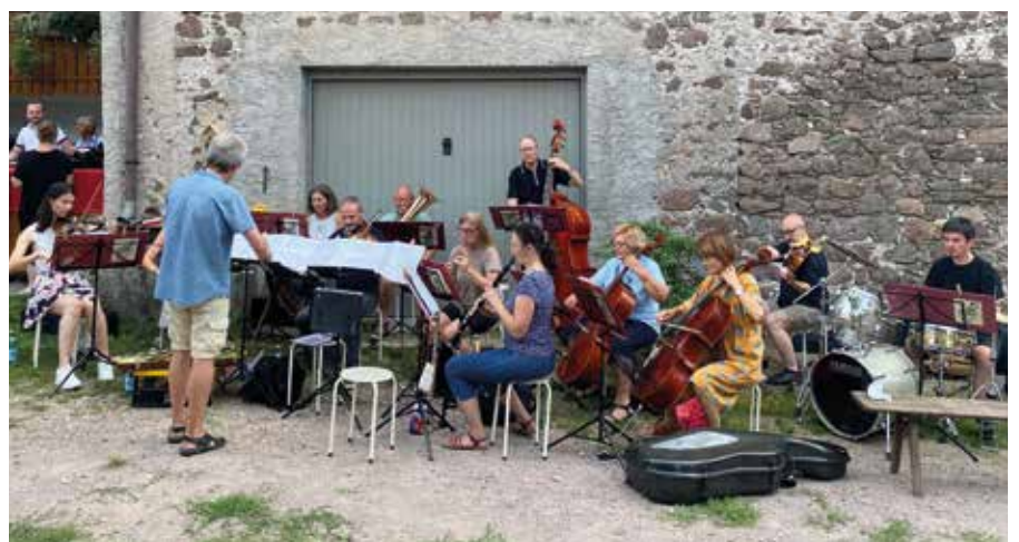
„Streichholz & Fiedl“ sorgte wieder für die musikalische Umrahmung.