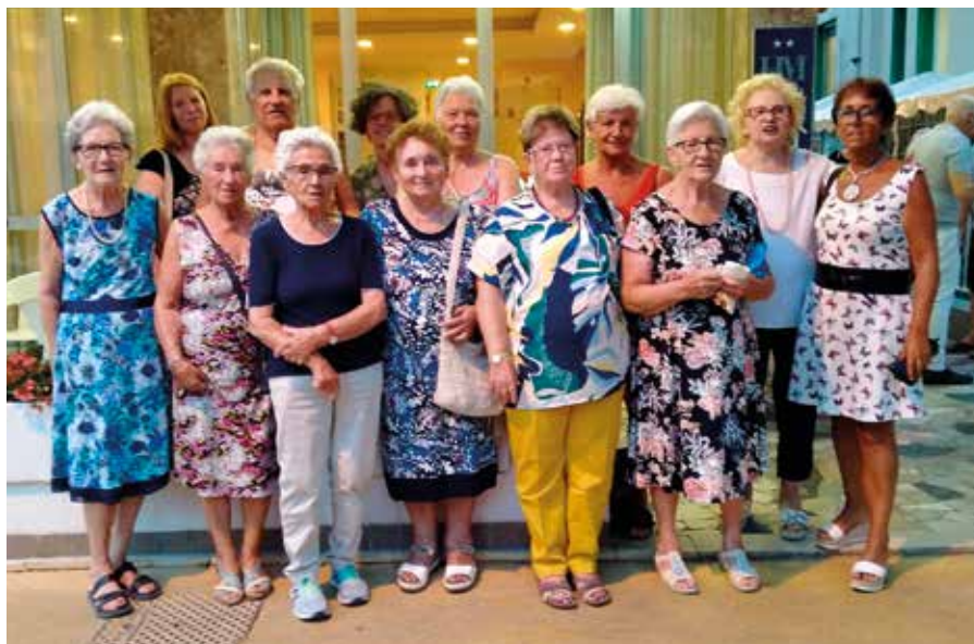
Il gruppo anziani al mare