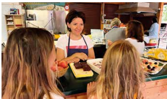
Specialità per i visitatori

ciazione Zusammenleben Auer – Vivere insieme Ora. L'8. Festa delle Famiglie è stata inoltre supportata dall'associazione Pro Schwarzenbach e in particolar modo dalla Cassa Raiffeisen Bassa Atesina - Filiale di Ora.