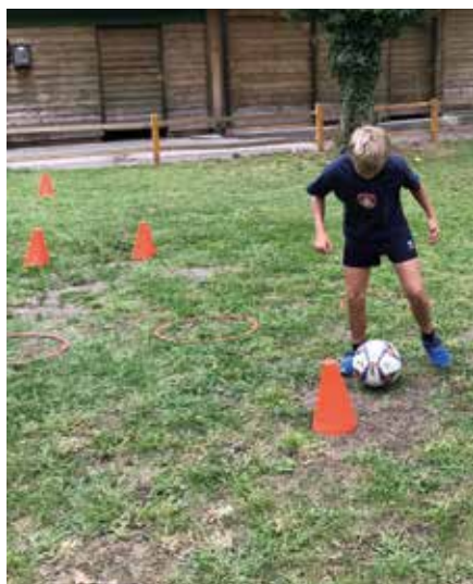
Geschicklichkeit mit dem Ball.