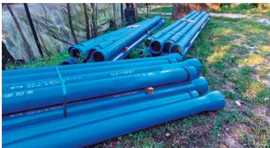
I tubi dell'acquedotto sono in ghisa con coibentazione di vetro cellulare e rivestimento con lamiera.

I costi totali dell'opera si aggirano sul € 1.000.000,00. La ditta Klapfer Bau Srl di Trento si è aggiudicata l'incarico per l'esecuzione dell'opera. I lavori riguardanti la nuova condotta principale dell'acqua potabile Casignano – San Daniele hanno avuto inizio il 28 agosto e devono essere portati a termine entro 180 giorni (fine febbraio). Il nuovo acquedotto ha una lunghezza di ca. 4 km.