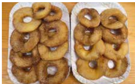
Waren sehr gefragt die leckeren Apfelkiachel