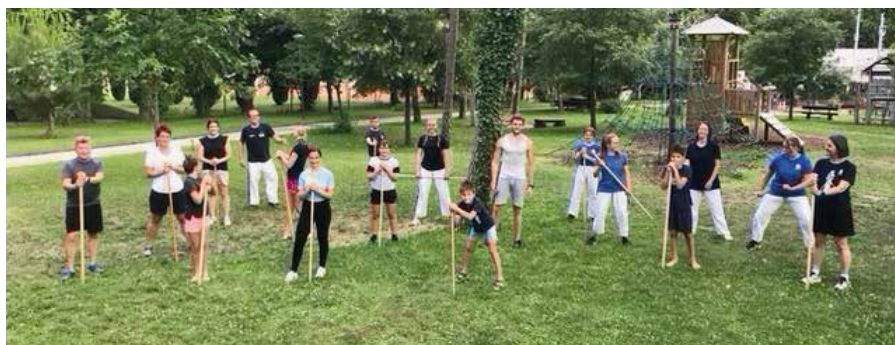
Training im Park Schwarzenbach

Ab Ende September laufen unsere Kurse wieder. Melde dich jetzt bei unseren Kursen an und sichere dir deinen Trainingsplatz. Die Anmeldungen sind seit 15. September offen, die Plätze sind begrenzt.