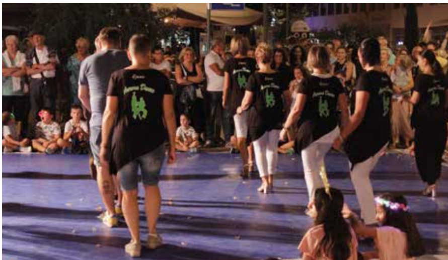
Tänzerinnen und Tänzer des Vereines Aurora Dance.