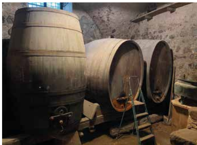
Ein Blick in den Keller