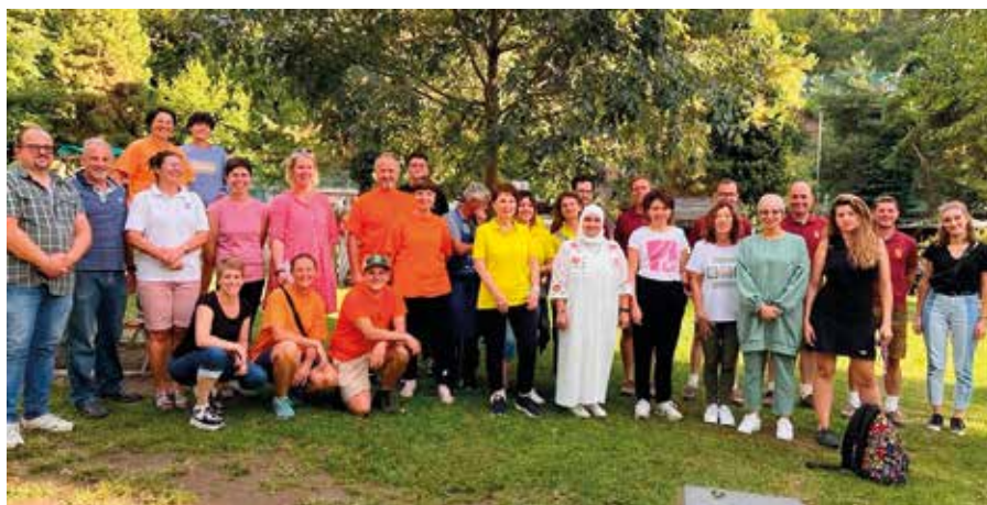
Viele Mitglieder verschiedener Vereine wirkten beim Fest mit

Für das leibliche Wohl sorgten die Vereine Zusammenleben Auer - Vivere insieme Ora und der Bildungsausschuss Auer sowie viele fleißige Frauen und Männer. Neben der Küche und Teestube aus Marokko, erfreuten sich Groß und Klein an Häppchen, Saft, Kaffee und Kuchen. Nicht fehlen durfte - wie jedes Jahr - das Popcorn.