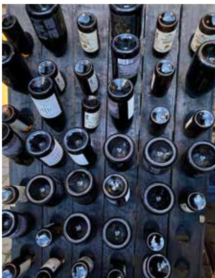
Viele wollten den Cider kosten, übrig blieben viele leere Flaschen.