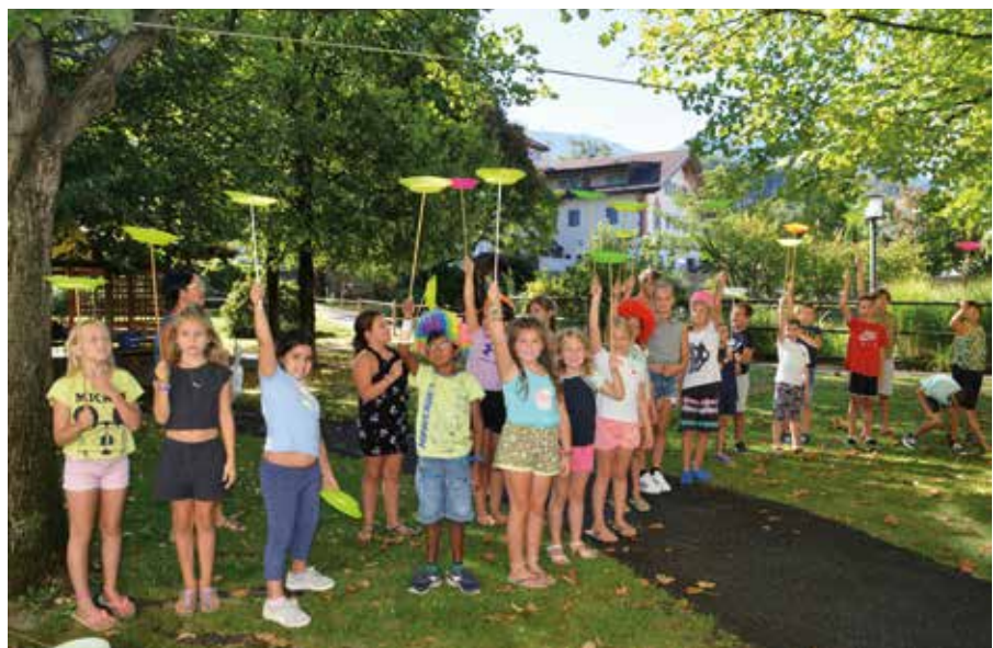
Aufführung im Altenheim Robert Prossliner