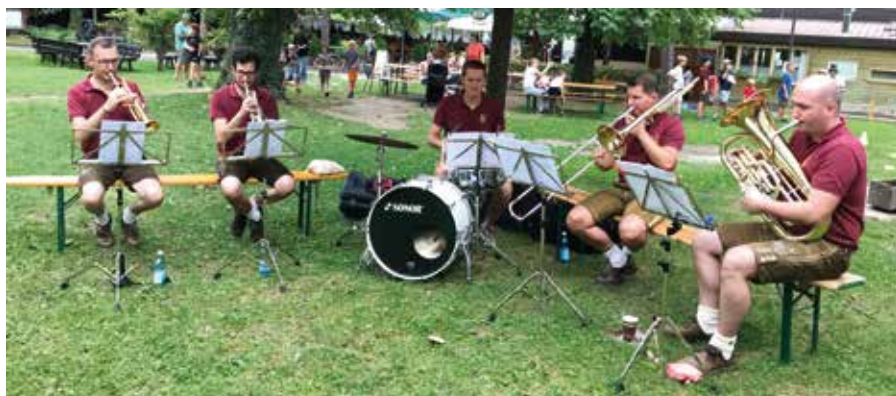
Die Bläsergruppe der Musikkapelle