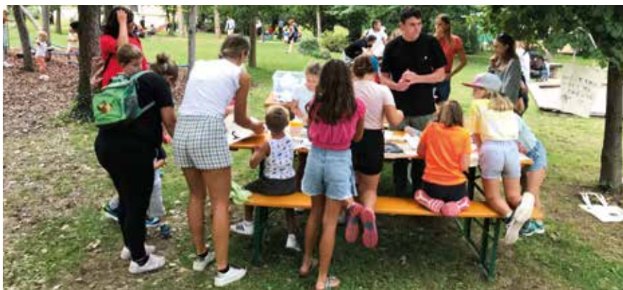
Stampa di borse

Le associazioni Zusammenleben Auer – Vivere insieme Ora e il Comitato di formazione permanente di Ora si sono fatte carico del ristoro, grazie alla laboriosità di molte donne e uomini. Accanto alla cucina e all'angolo del tè dal Marocco, grandi e piccini hanno potuto gustare tartine, succhi di frutta, caffè e squisite torte. Immane come ogni anno – il popcorn.