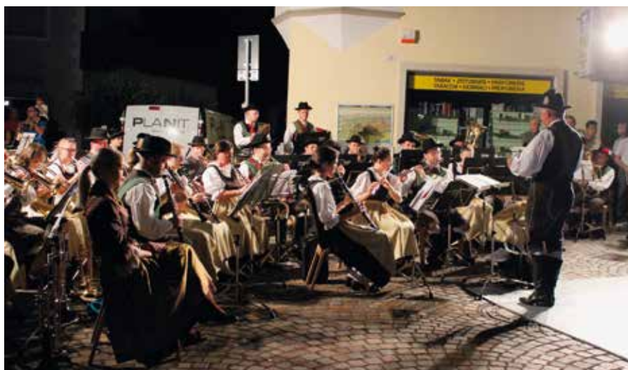
La banda musicale

Ma finalmente dopo due lunghi anni siamo riusciti a presentare il Progetto in occasione del Martedì Lungo.