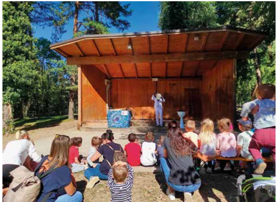
Die Kinder verfolgen gespannt die Clown-Show