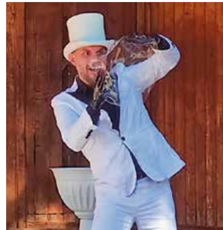
L'artista ha formato figure con le bolle di sapone.

Siete ancora alla ricerca di un luogo adatto per festeggiare il compleanno del vostro bambino? Non esitate a contattarci all'indirizzo info@elki-auer.it o 351 75 37 329. Se la sala è libera, siete invitati a utilizzarla.