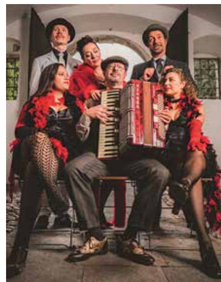
Das Freie Theater Bozen spielte wieder in der Aula Magna

Nach einer ersten öffentlichen Aufführung spielte das Freie Theater das Stück auch für die Schüler*innen der sieben Abschlussklassen der Fachoberschule für Landwirtschaft und der Wirtschaftsfachoberschule. Die Person Bert Brecht und seine Werke wurden so dem jungen Publikum nähergebracht.