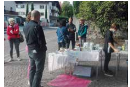
Fairer Kaffee wurde vor der Bibliothek verkostet.

allem die Senior*innen eingeladen in die Bibliothek zu kommen, um ihnen die vielen verschiedenen Angebote vorzustellen. Alles in allem eine sehr gelungene Veranstaltung!