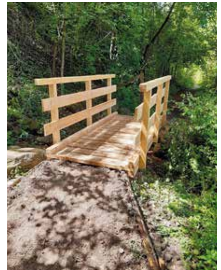
Neue Holzbrücke im Forchwald