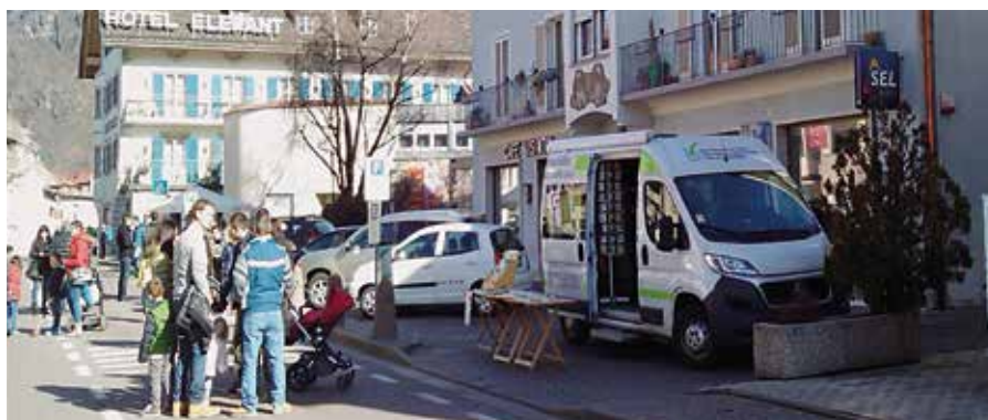
Lo sportello mobile del consumatore sosterà a Ora

Chi avesse dei quesiti in ambito consumeristico, o desiderasse semplicemente informarsi, è invitato a passare il 23 novembre dalle ore 9.30 alle 11.30 a Ora.