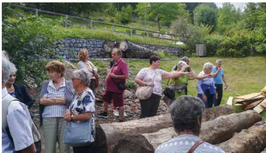
Beim alten Sägewerk Taialacqua begann die Wanderung zur St. Antonius Kapelle

Mit zwei Kleinbussen wurde am Nachmittag gestartet. Über Mezzolombardo ging die Fahrt hinauf auf die Hochebene der Paganella, vorbei an den Fremdenverkehrsorten Fai und Andalo und weiter nach Molveno. Der Ort Molveno, direkt am See gelegen, ist schon seit dem Ende des 19. Jahrhunderts ein populärer Ferienort. Im Sommer hat man zahlreiche Sport- und Freizeitmöglichkeiten. Am Seeufer und in der Umgebung gibt es zahlreiche Wanderwege, auf denen man die artenreiche Flo-