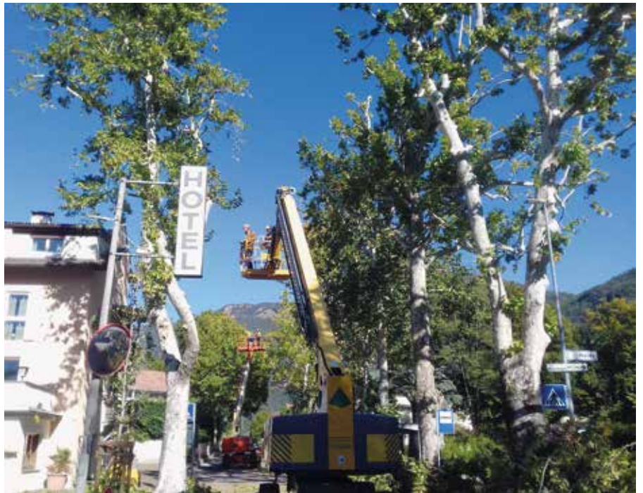
Die Platanen wurden geschnitten und gepflegt

Die 25 Bäume umfassende Allee an der südlichen Dorfeinfahrt ist im Landschaftsplan der Gemeinde als Naturdenkmal eingetragen und somit besonders geschützt. Der wertvolle Baumbestand ist aus stattlichen Platanen sowie einigen Ginkgo zusammengesetzt und prägt in markanter Weise das Erscheinungsbild dieses Dorfteiles und die Zufahrt zur Ortschaft. Gepflanzt wurden die Bäume wohl um 1930 beim Bau der Brennerstaatsstraße. Vom Fachmann Valentin Lobis wurde im Vorjahr ein Gutachten erstellt, in welchem für jeden Baum die genauen Eingriffsmaßnahmen beschrieben sind. Die Firma Baumtec hat nun die Pflegearbeiten laut diesem Gutachten durchgeführt. Die Kosten der Arbeiten wurden je zur Hälfte von der Gemeinde und vom Amt für Natur des Landes finanziert.