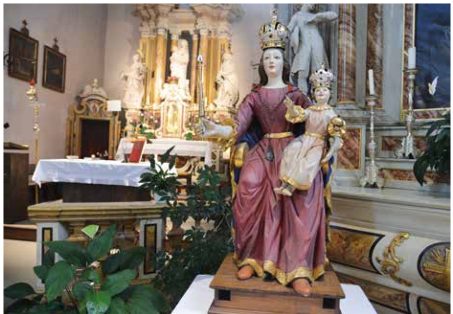
Rosenkranzsonntag, das Patroziniumsfest unserer Marienkirche