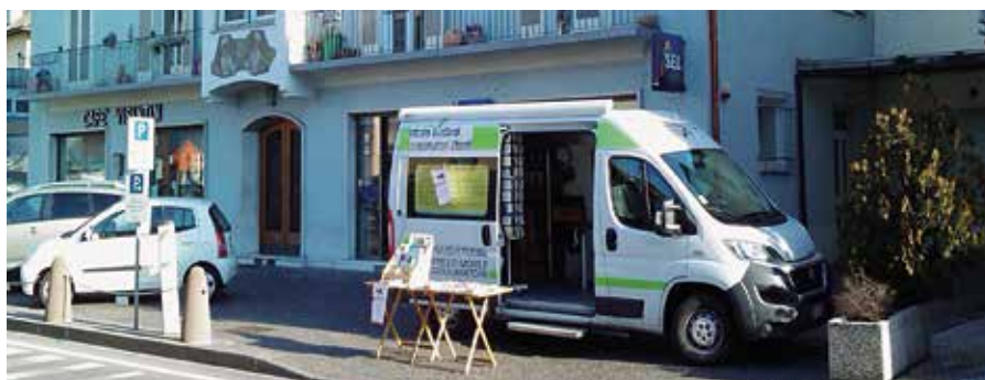
Das Verbrauchermobil kommt nach Auer

Das Verbrauchermobil führt die gesamte Infothek der Verbraucherzentrale mitsamt den neuesten Tests mit. Außerdem finden Sie vor Ort alles, was es an Infomaterial in der VZS gibt. Betreut und begleitet wird das Mobil von einem erfahrenen Berater.