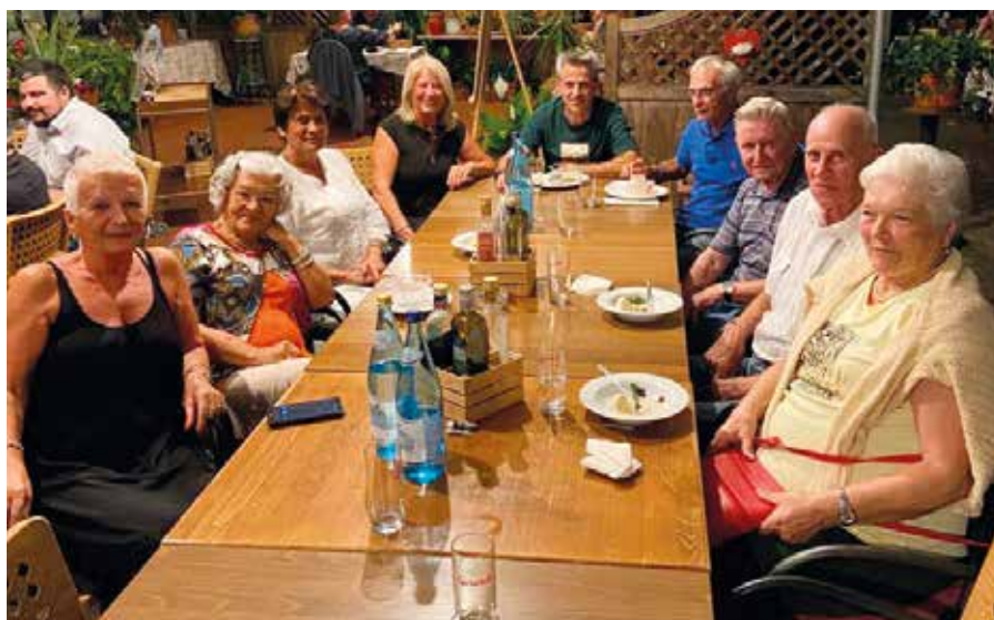
I volontari di “Pasti a domicilio”

Il Sindaco e la direttrice del Distretto ringraziano tutti i 23 volontari per la loro disponibilità. Questo servizio viene offerto ai nostri