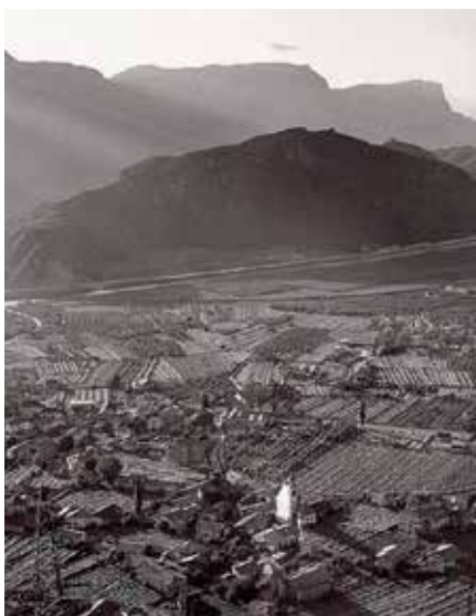
Auer in den 1950er-Jahren