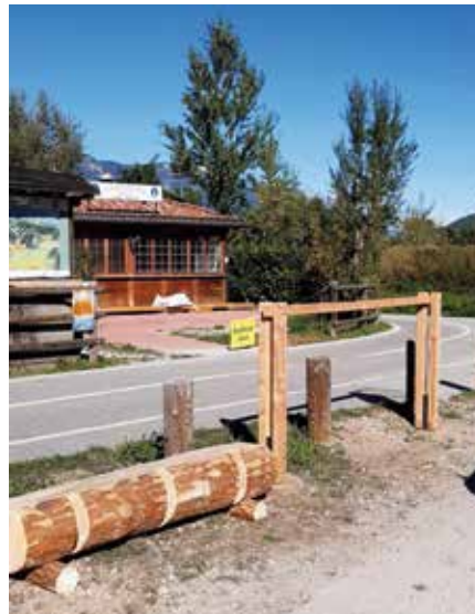
Die neuen Fahrradständer entlang der Radwege