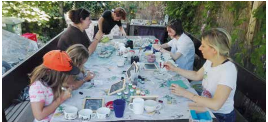
Die Jugendlichen bemalten die Tassen für die Aktion Fairer Kaffee

Einige Jugendliche haben sich bereits im August getroffen, um die Tassen für die Verkostung zu verzieren. Am 2. Oktober standen sie mit Tassen, Kaffee und Keksen vor der Bibliothek und Passanten und Bibliotheksbesucher*innen konnten erfahren, wie gut „a fairer“ Kaffee schmeckt. Zugleich waren vor