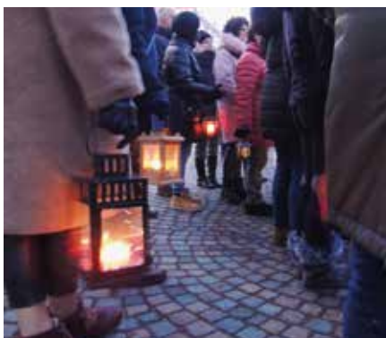
Heuer bekommen die Kleinen mit ihren Laternen Geschichten aus Auer erzählt

Die Teilnehmerzahl ist auf 20 Kinder begrenzt.