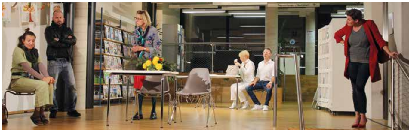
Die Heimatbühne brachte die witzig-böse Komödie „Frau Müller muss weg!“ in der Bibliothek zur Aufführung