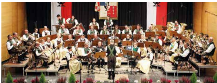
Die Musikkapelle Auer

Am Samstag, 13. November, findet um 20 Uhr das traditionelle Cäcilienkonzert der Musikkapelle Auer statt. Nach einem Jahr Pause darf die Musikkapelle in diesem Jahr erfreulicherweise die Zuhörer wieder in der Aula Magna begeistern.