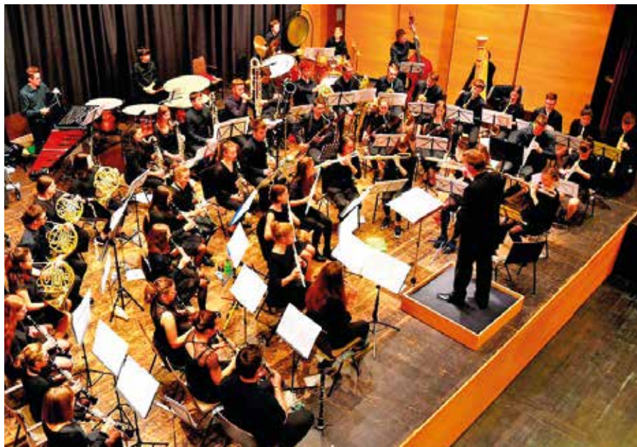
Das Holzblasorchester HoBlaO spielt am 7. November um 11 Uhr in der Aula Magna