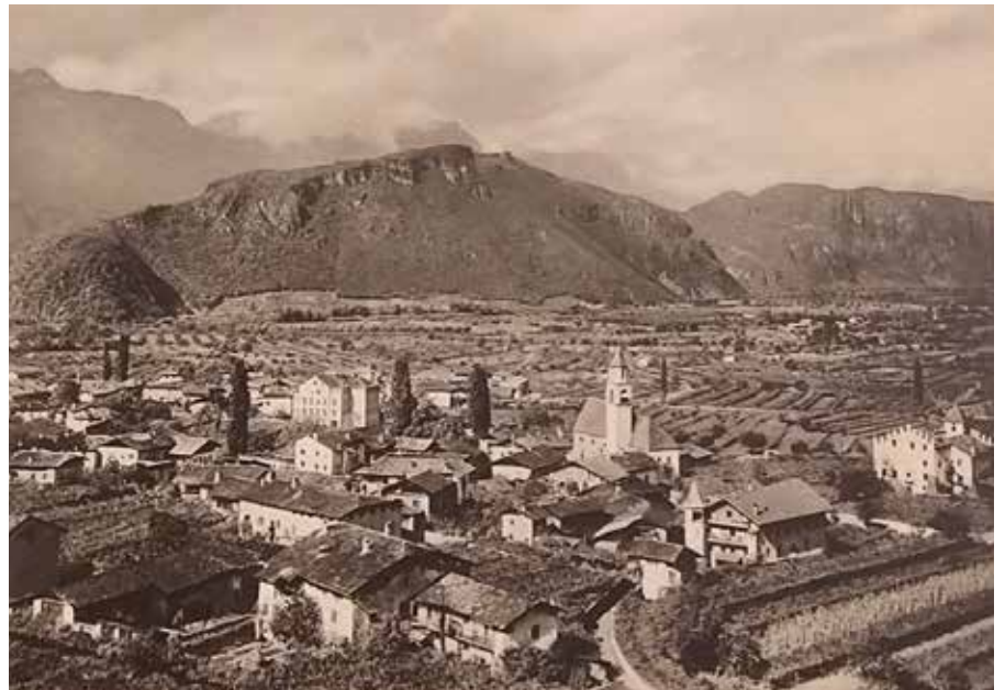
Auer gegen den Mitterberg in den 1930er-Jahren

Vor rund 100 Jahren nahm auch die Industrialisierung zu, mit entsprechenden Auswir-