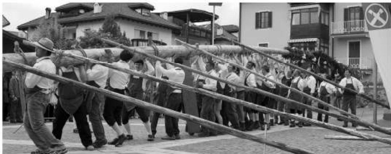
Risikant und mühsam, aber erfolgreich, stemmten 40 Männer den Maibaum in 45 Minuten in die vorgesehene Halterung.