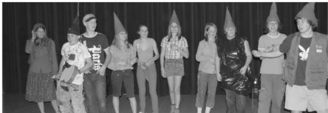
Die Jungschargruppe aus Auer erreichte mit dem Theaterstück »Die sieben Zwerger« den zweiten Rang.

JUNGSCHAR AUER UND JUGENDDIENST UNTERLAND