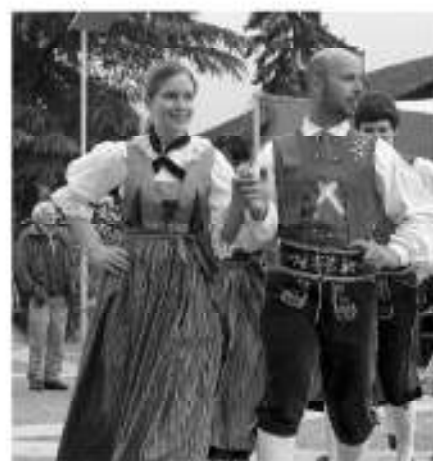
Einmarsch der Volkstanzgruppe Auer.

Der ursprüngliche Brauch des Maibaumaufstellens war ein heidnischer und ist mit Fruchtbarkeits- und Leben-Erneuernden Symbolen behaftet. Er war im gesamten deutschen Gebiet weit verbreitet. In seiner heutigen hohen Form mit grüner Baumspitze, dem »Maibuschn«, Girlande, Kränzen, Bändern, Rosen und Hahnenfedern geschmückt ist der Maibaum seit dem 16. Jahrhundert bekannt.