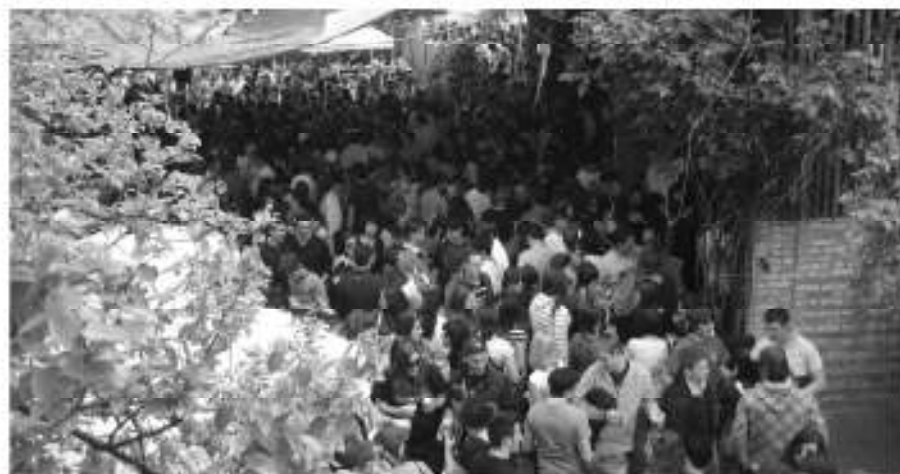
Un immagine durante la festa di San Marco.