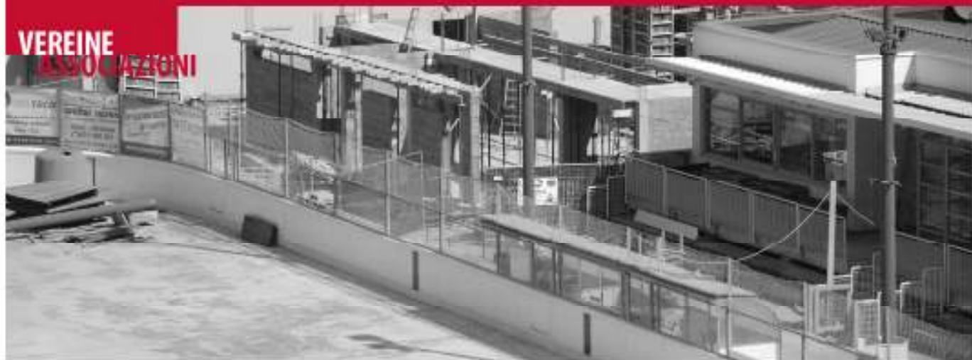
Umbauarbeiten in der Erholungszone Schwarzenbach.