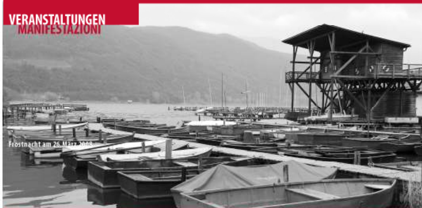
Frostnacht am 26. März 2009