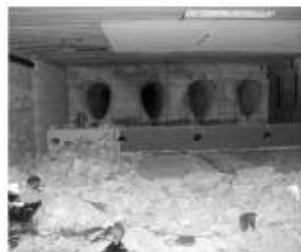
Abbruch der alten Schießbröhen.

Ein weiteres Vorhaben betrifft die Sanierung und Errichtung neuer Umkleidekabinen und Vereins-