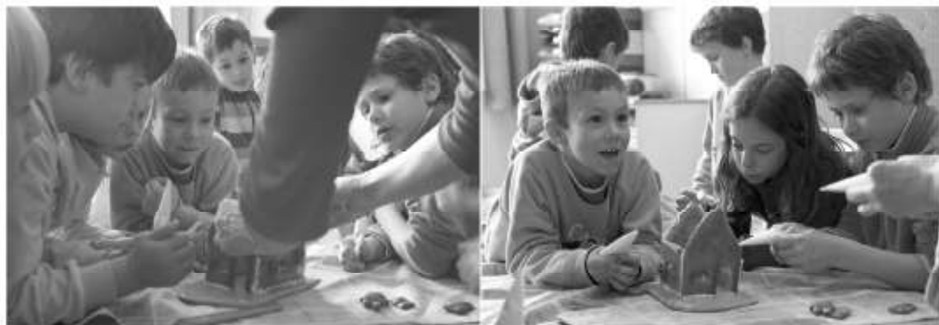
Die Schulkinder der zweiten Klassen beschäftigten sich mit dem Thema »Märchen« und bastelten mit einer Schülmutter ein Hexenhaus.