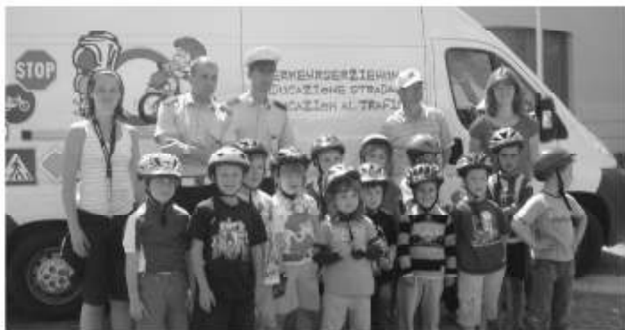
Die Kinder mit den Verkehrserziehern.