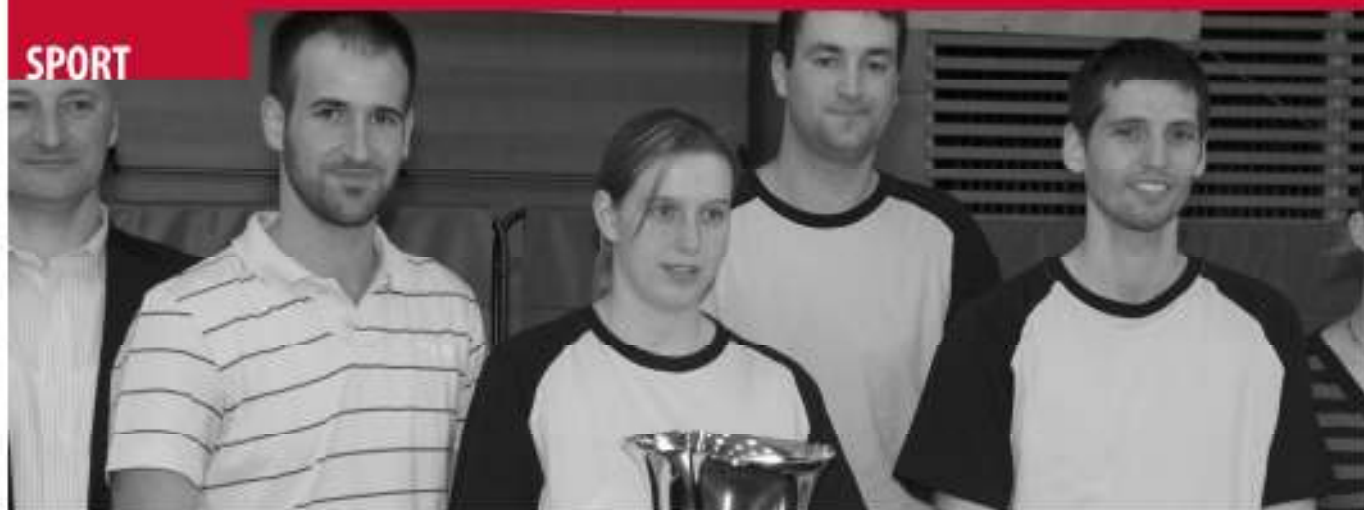
Schwarzenbach-Cup Sieger 2008: TG Donzdorf I (Deutschland)

ASC AUER RAIFFEISEN · SEKTION TISCHTENNIS