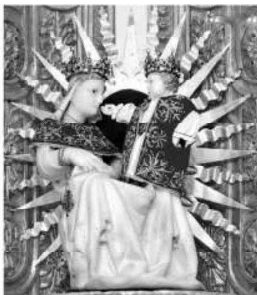
Madonna von Ettal.

Die nächste Etappe der Reise war das Schloss Linderhof. Es ist das kleinste der drei Schlösser Ludwigs und das einzige, das voll-