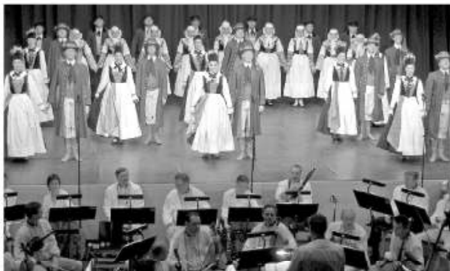
Das sorbische Nationalensemble.

Die Sorben sind eine seit Jahrhunderten in Ostdeutschland lebende slawische Minderheit, die auf die Ober- und Unterlausitz in Sachsen und Brandenburg aufgeteilt ist. Das Sorbische Nationalensemble (SNE) gehört laut Eigenzuschreibung zu den größten professionellen Tourneebetrieben Deutschlands und ist kultureller Botschafter der Oberlausitz und des sorbischen Volkes. Kürzlich war es in Auer zu Gast – und verzauberte die Zuhörer mit seinen