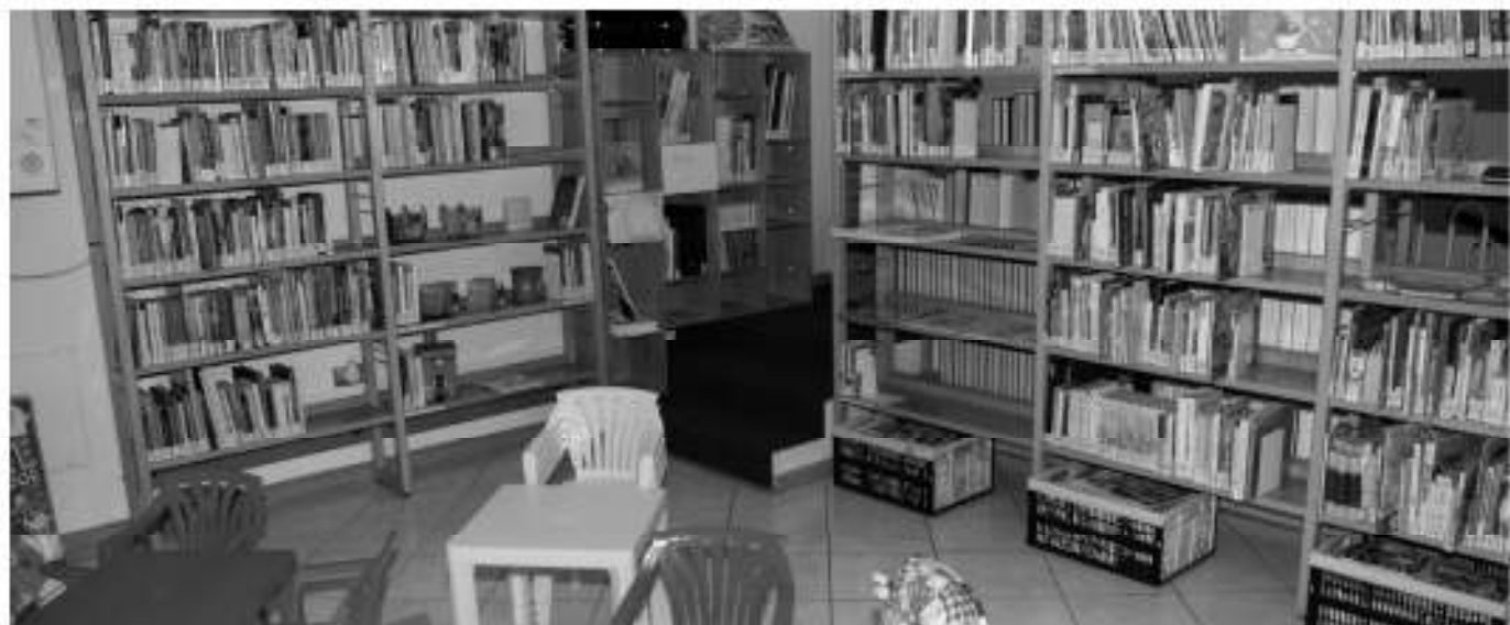
La biblioteca «Dante Alighieri»