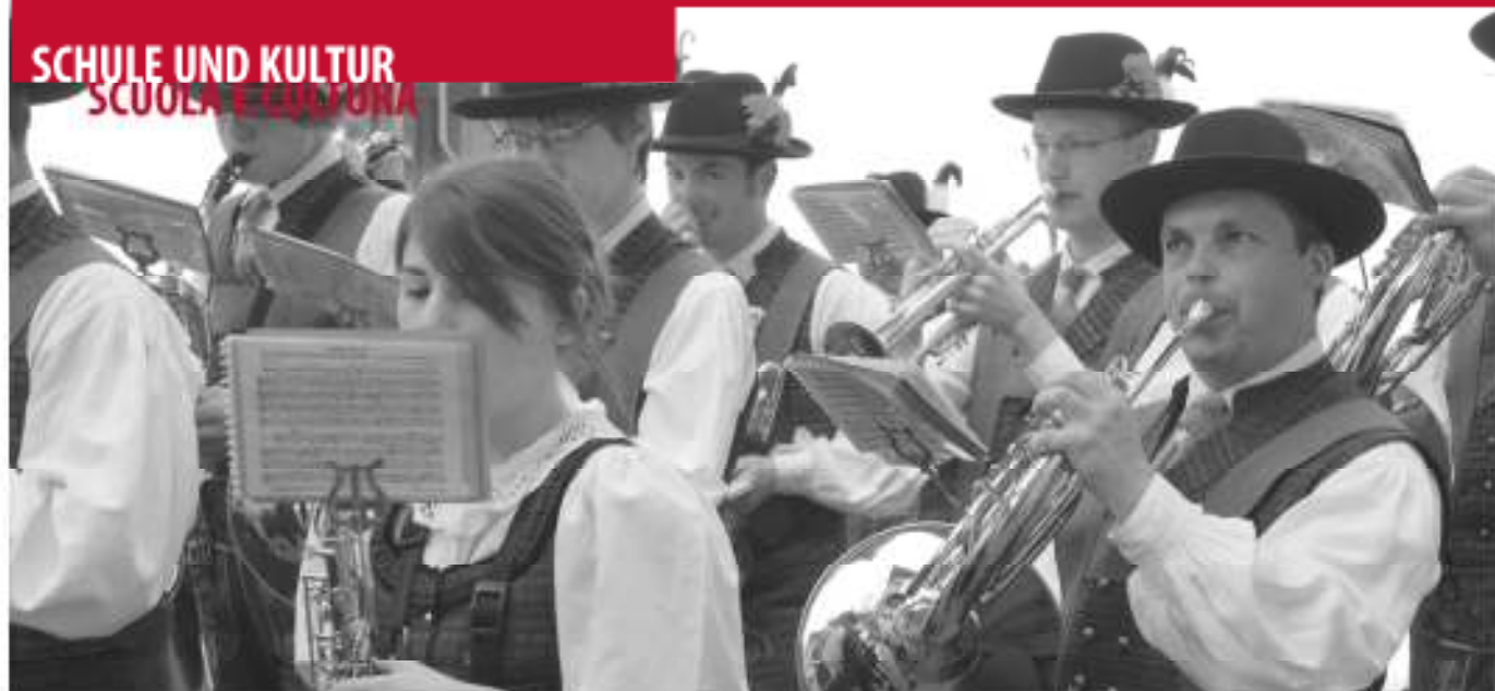
Bachprozession: Einzug in den Simoninihof zum Frühschoppen.