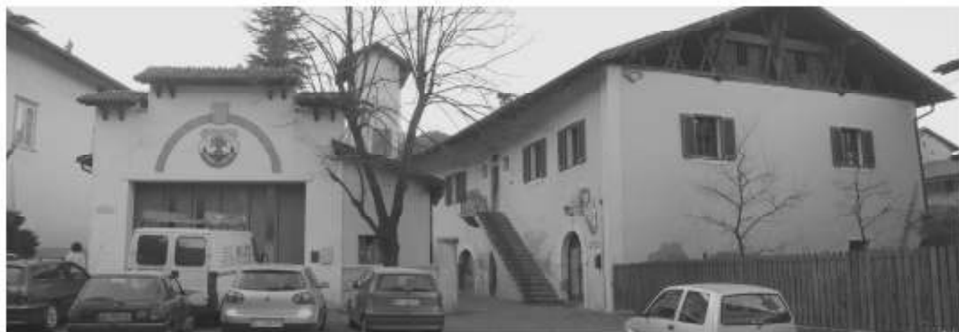
In die Wege geleitet wurde der Verkauf der alten Musikschule und Feuerwehrrhalle. • Sono in corsa la vendita della ex scuola di musica e della ex caserma dei vigili del fuoco.