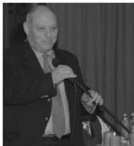
Landeshauptmann Luis Durnwalder.

ne. Hinter jeder guten Tat stehen Menschen, die einen Grundstein gelegt haben, die aus Eigeninitiative etwas bewegen. Heute wird oftmals nur verlangt, ohne selbst einen Beitrag zu leisten. Es ist heute auch nicht mehr modern, zu den christlichen Grundwerten zu stehen, wenngleich dies notwendig ist. Gleichzeitig müssen wir aber auch Verständnis für andere haben», betonte der Landeshauptmann.