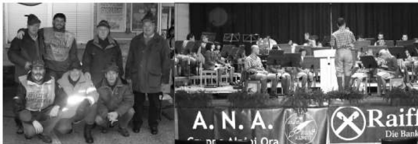
Il gruppo Alpini di Ora davanti al negozio A&amp;O.