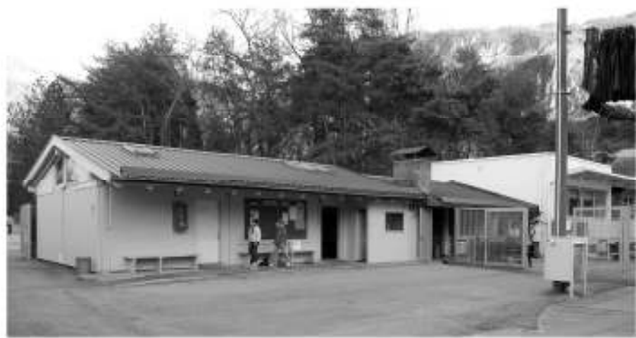
Gli spogliatoi presso il campo di ghiaccio verranno risanati.

L'amministrazione ha difeso la propria scelta, anche alla luce delle risorse economiche attualmente disponibili. «Demolire e ricostruire 7000 metri cubi, questa la cubatura globale del complesso, avrebbe un costo vicino ai 3 milioni di Euro, cifra assolutamente fuori dalla portata attuale. Di fatto un progetto globale esiste già», ha affermato il sindaco Roland Pichler. «Nella struttura del bar sono già presenti i piloni per realizzare l'eventuale futura copertura del campo, che quindi non risulta esse-