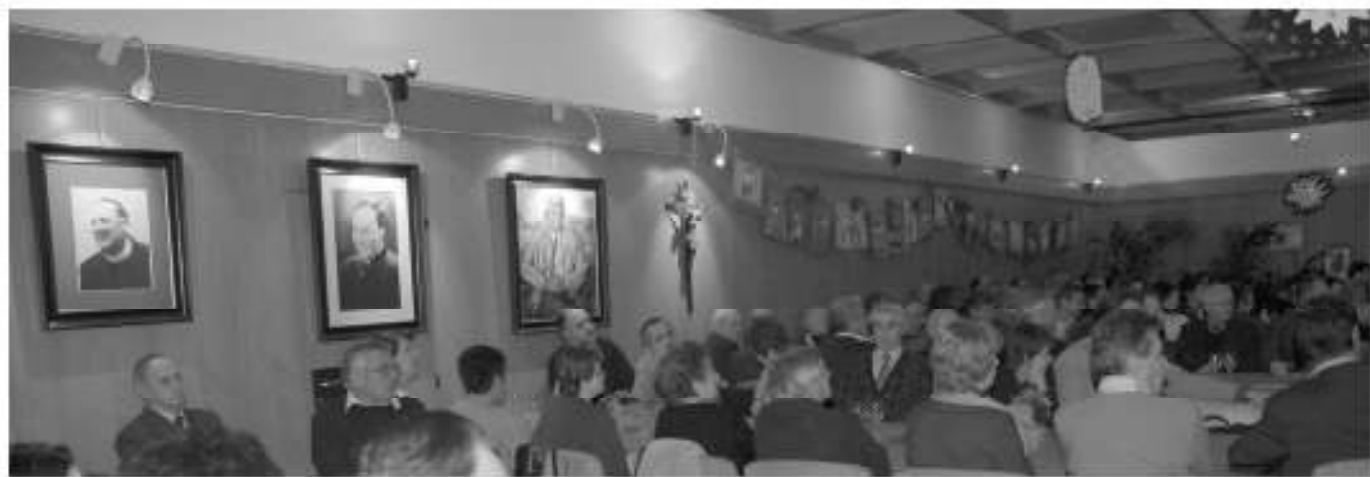
Grande festa nella «Haus der Vereine» per i quarant'anni della struttura.