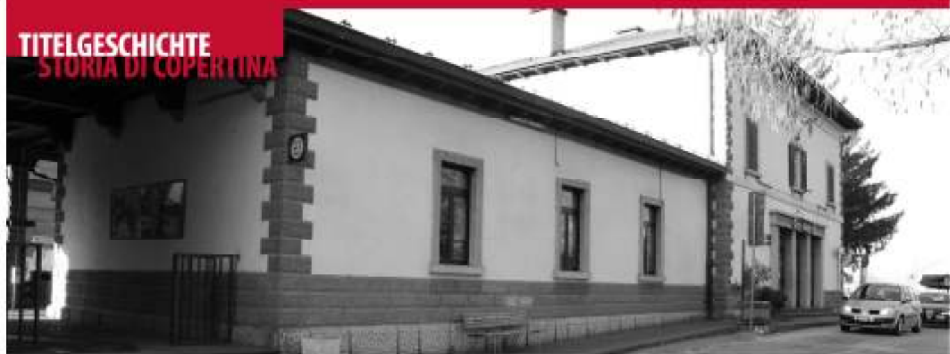
La stazione ferroviaria di Ora.