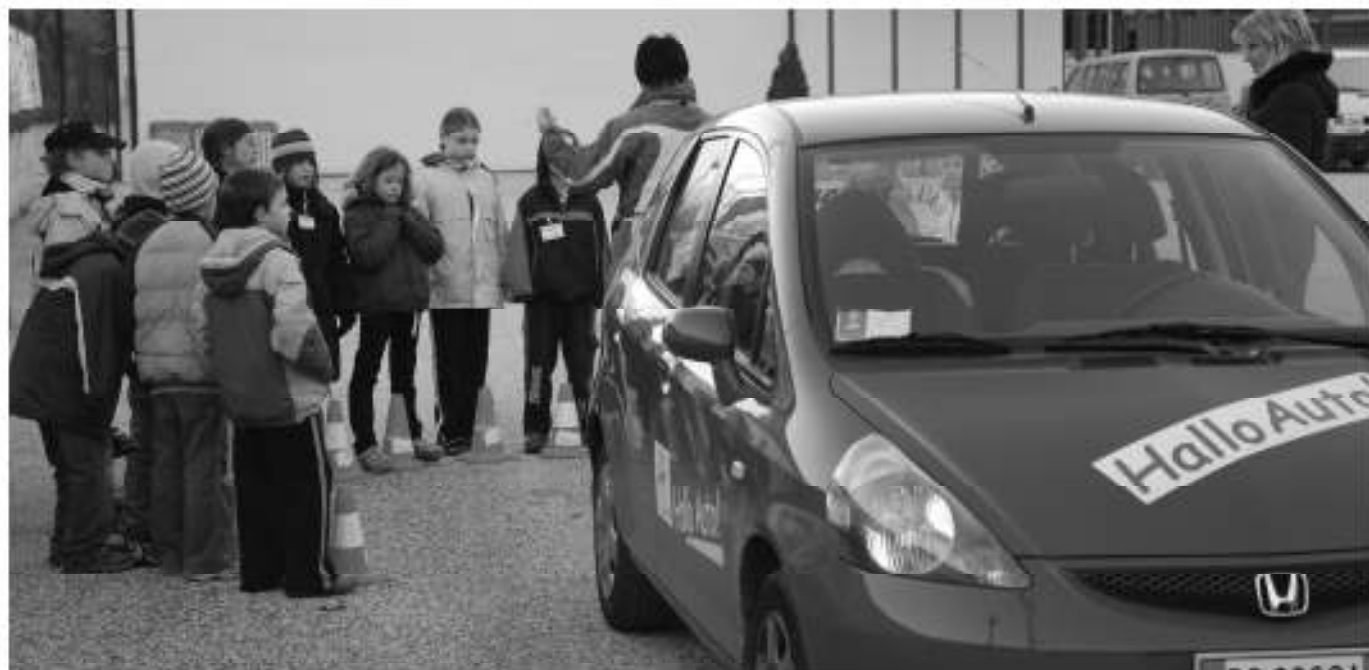
Mit der Aktion »Hallo Auto« wird richtiges Verhalten im Straßenverkehr eingeübt.