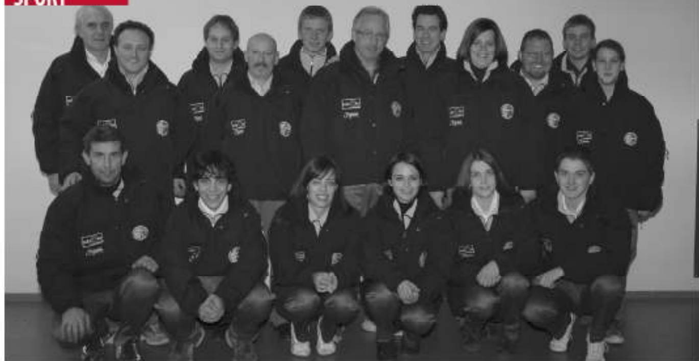
Im Bild alle Aurer Wettkampfschützen.