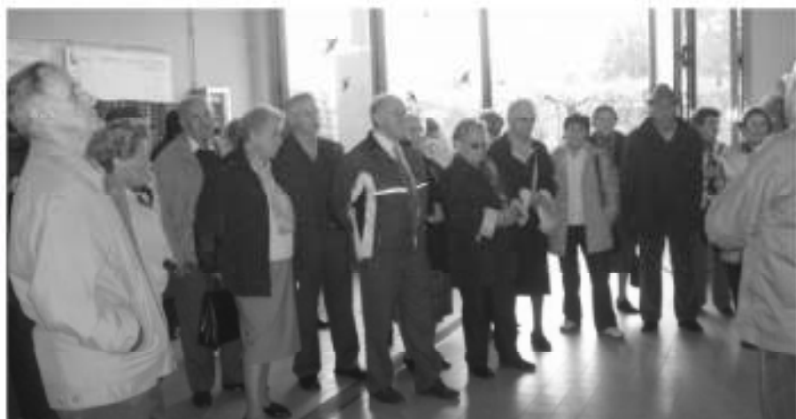
Aufmerksame Zuhörer bei der Besichtigung des landwirtschaftlichen Betriebes in der Laimburg.

La San Vincenzo di Ora esprime un sentito ringraziamento a tutti coloro che in occasione della colletta cimiteriale del giorno di Tutti i Santi hanno contribuito a rimpinguare le casse del sodalizio permettendo, in tale maniera, di portare silenzioso aiuto alle tante persone che si trovano in difficoltà economica e sociale anche nell'ambito della nostra comunità. Nonostante il rincaro dei prezzi ed il calo dei redditi familiari va dato atto che il vincolo di solidarietà dei nostri concittadini verso le persone in condizioni di maggiore difficoltà è rimasto saldo. Grazie!