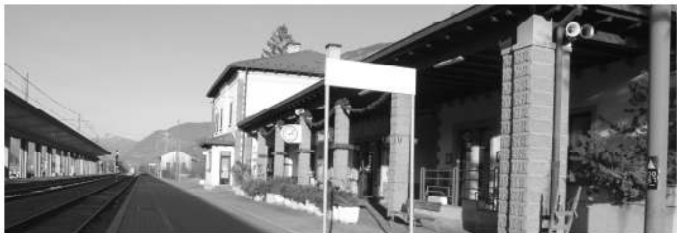
Renovierungsarbeiten des Aurer Bahnhofes stehen bevor.