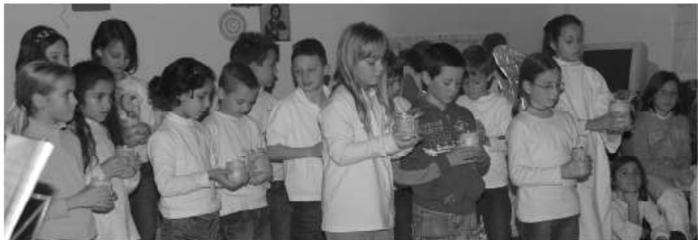
Die Volksschule platzt aus allen Nähten. • Spazio mancante nelle classe della scuola elementare.