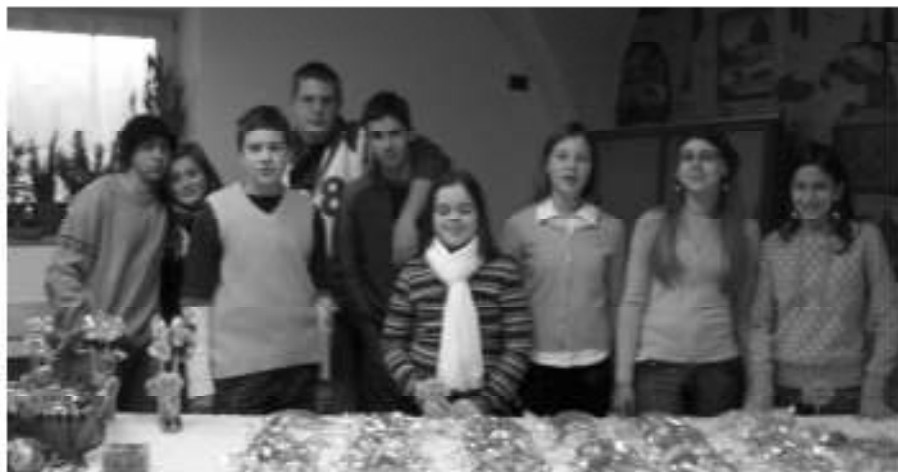
Foto di gruppo per i ragazzi del venerdì.