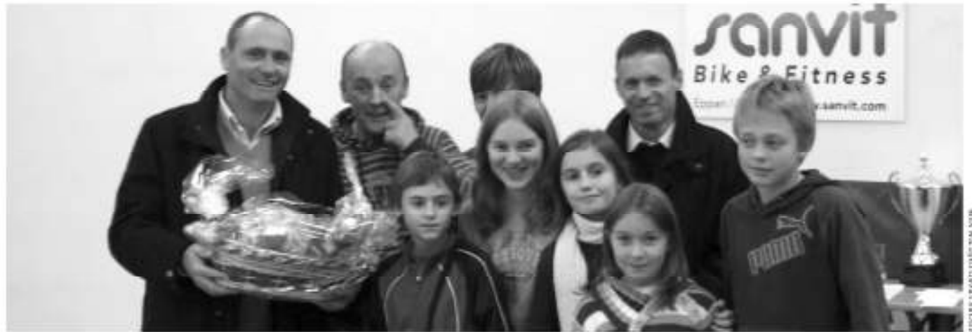
Prämierte Eltern und Kinder während der Preisverteilung der Aurer Dorfschießerschaft.

ASC AUER RAIFFEISEN - SEKTION SPORTSCHÜTZEN