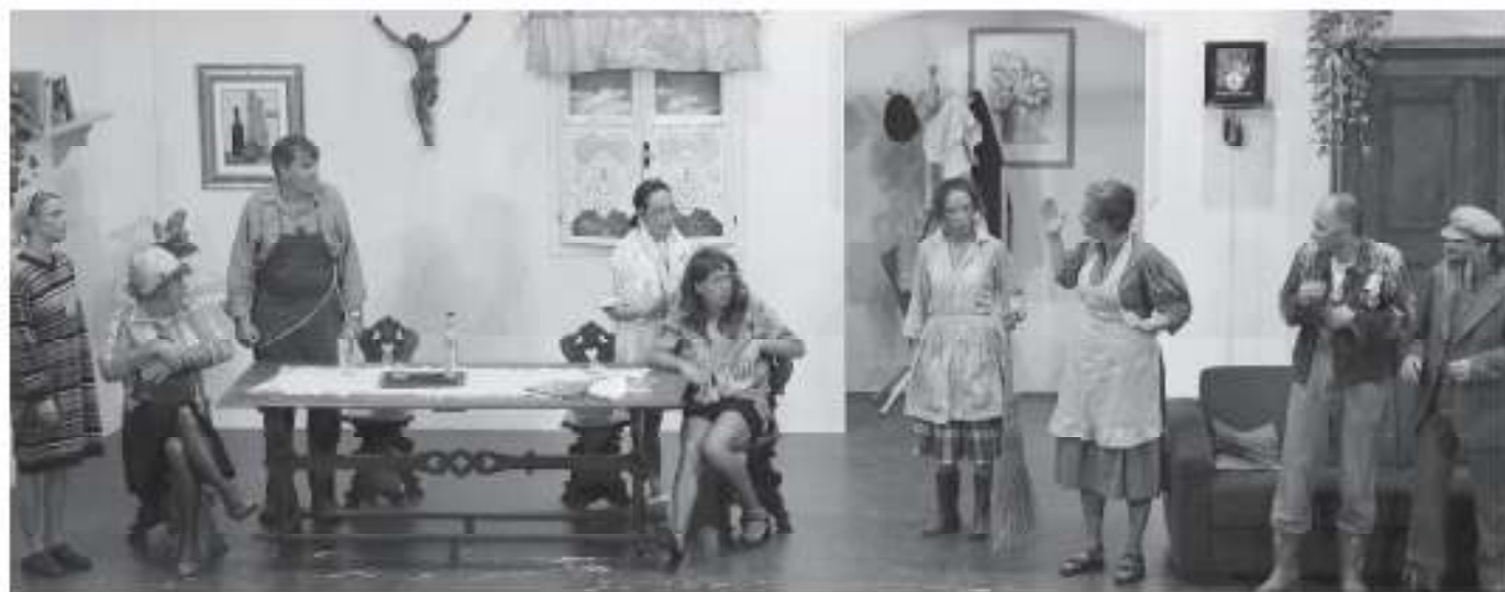
Das Stück »Weberwirtschaft« war eine Premiere für 4 Newcomer und ein Comeback eines alten routinierten Darstellers.