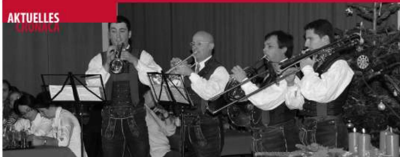
Ein Bläserquartett der Musikkapelle Auer umrahmte die Jubiläumsfeier im Haus der Vereine.