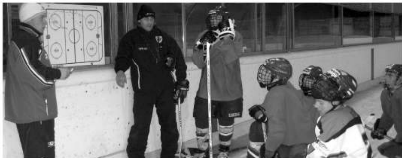
Eine Trainingsszene auf dem Aurer Eislaufplatz der Aurora-Frogs.