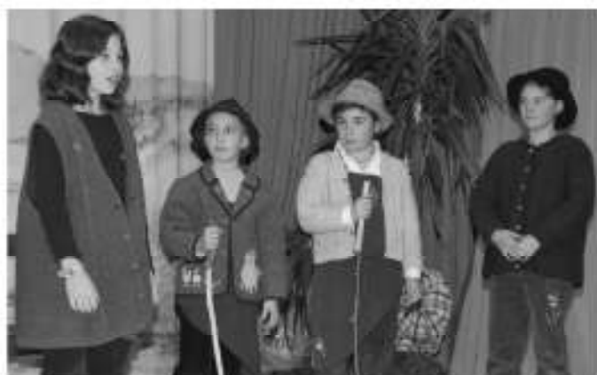
Hirten auf dem Weg nach Betlehem.