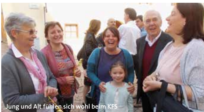
Jung und Alt fühlen sich wohl beim KFS