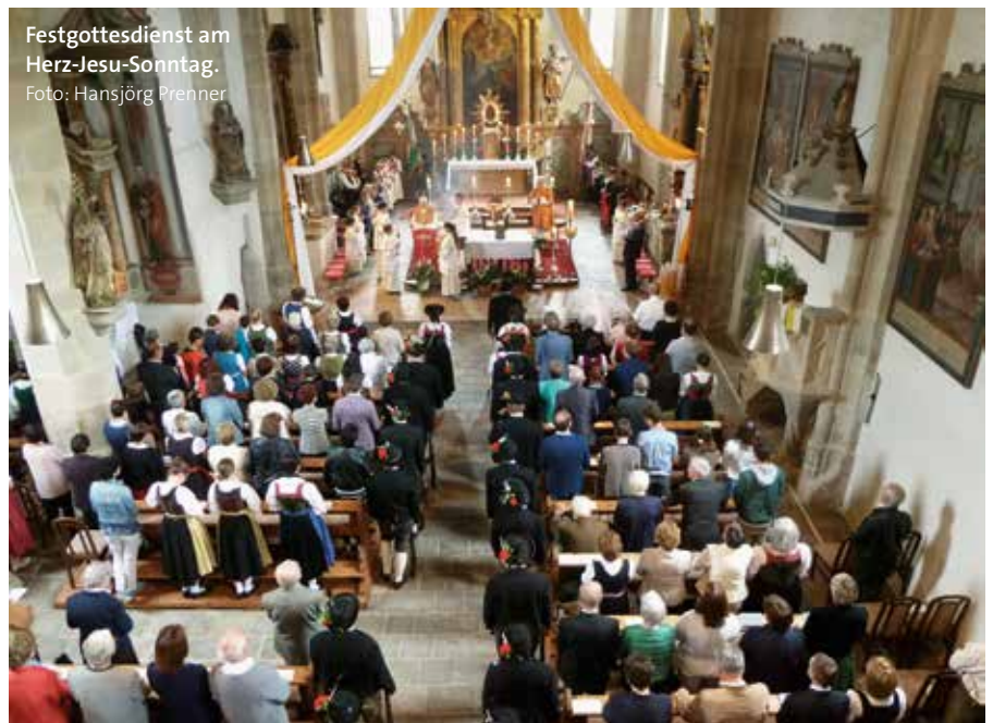
Festgottesdienst am Herz-Jesu-Sonntag.