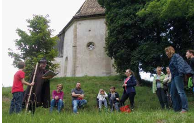
Eine Sagenwanderung führte nach St. Daniel