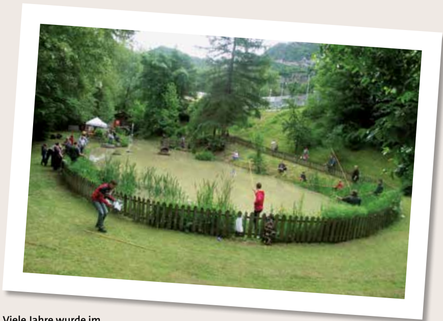
Viele Jahre wurde im Teich gefischt.