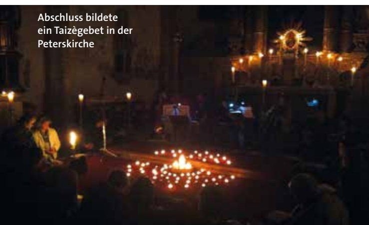
Abschluss bildete ein Taizègebet in der Peterskirche