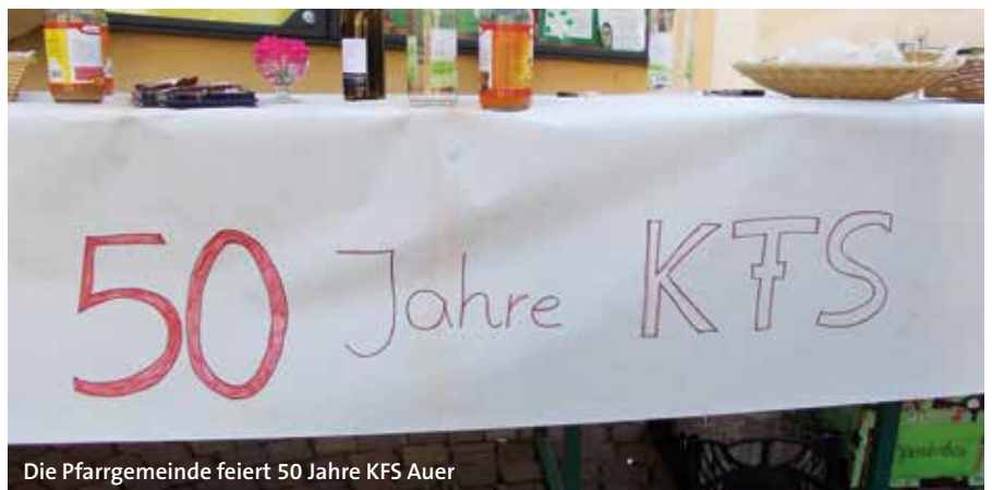
Die Pfarrgemeinde feiert 50 Jahre KFS Auer