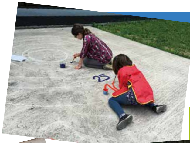
Mit Begeisterung dabei: Aurer Grundschüler