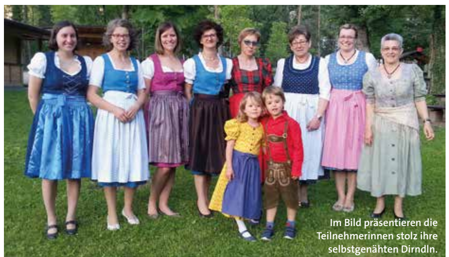
Im Bild präsentieren die Teilnehmerinnen stolz ihre selbstgenähten Dirndl.

Ein herzliches Vergelt's Gott geht auch an die Weiterbildungs-genossenschaft im Südtiroler Bauernbund für die Kostenübernah-