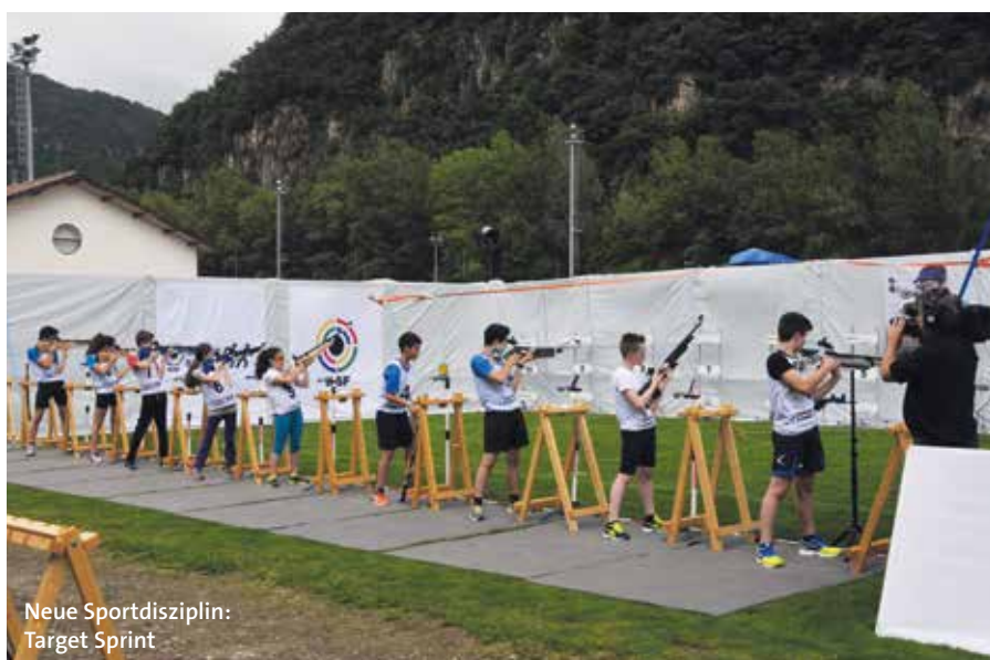
Neue Sportdisziplin: Target Sprint

Geschehen. Gar einige Zuschauer und interessierte fanden sich ebenfalls auf den Tribünen ein.