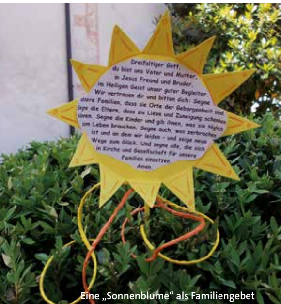
Eine „Sonnenblume“ als Familiengebet