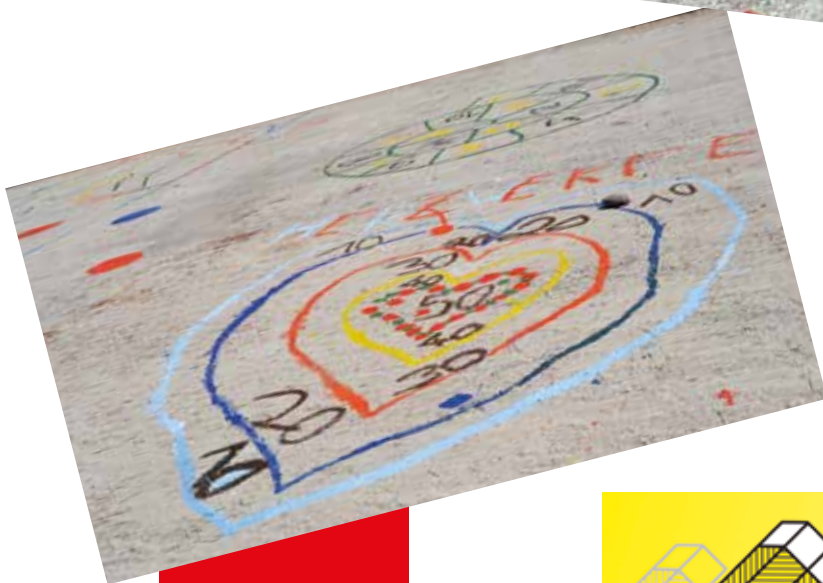
Einfach, aber effizient: Hüpfspiele für Kinder