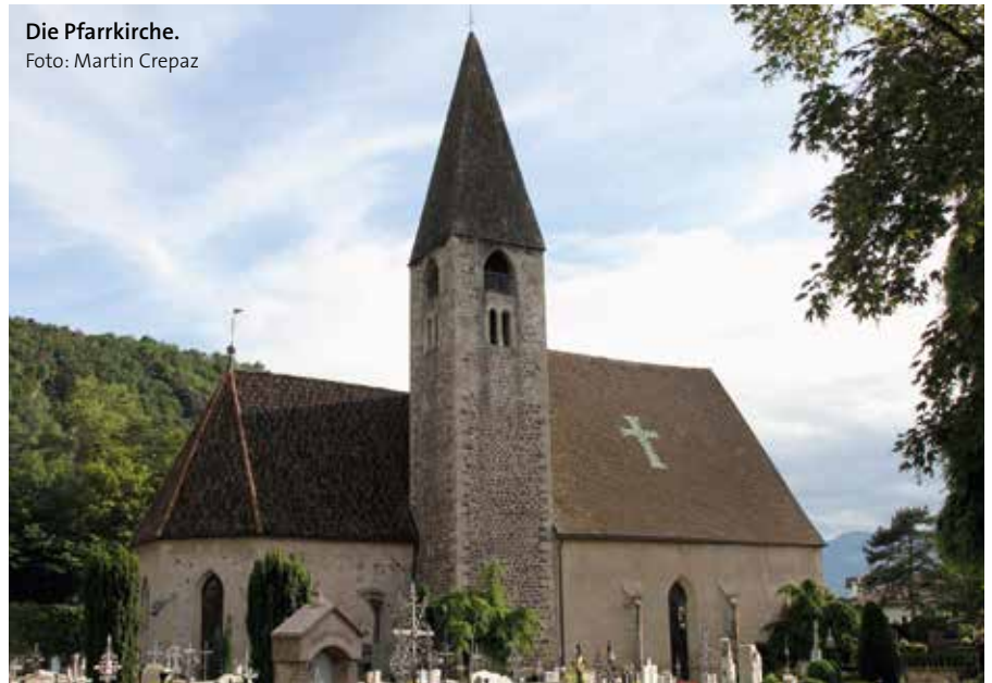
Die Pfarrkirche.