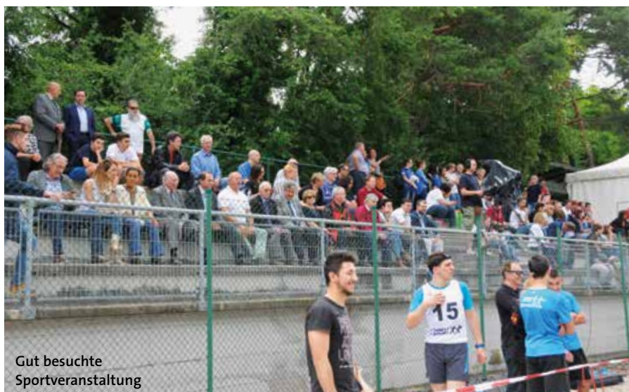
Gut besuchte Sportveranstaltung

Zur Unterstützung dieses Vorstellungswettkampfes, welcher ja zur Verbreitung dieser Sportart in Italien dienen soll, kamen 3 Staffeln (9 Athleten) der deutschen Nationalmannschaft mit ihrem Trainer nach Auer. Mit Spannung verfolgte der gesamte Vorstand des Nationalen Sportschützenverbandes aus Rom, sowie der Bürgermeister und die Sportassessorin der Gemeinde Auer das