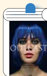
Outcast ALINA BRONSKY