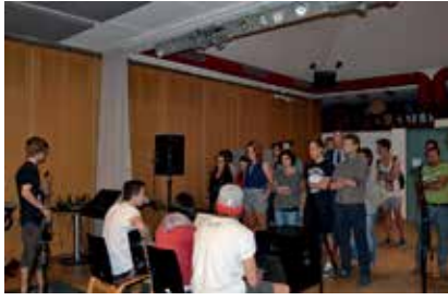
Im Bild das neue Probelokal