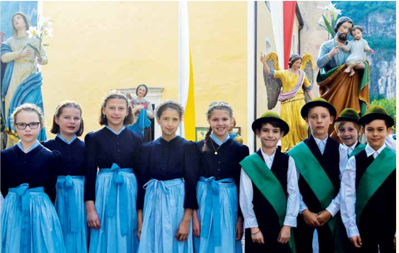
Die Kinder, die am Fronleichnamstag die Statuen der Hl. Notburga und des Jesuskindes getragen haben