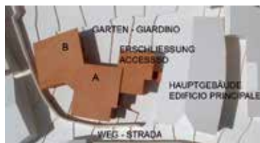
La pianta del nuovo complesso

evitare il più possibile l'«effetto sradicamento», creando edifici che rimandano alle vecchie costruzioni rurali ed alternando agli spazi costruiti aree