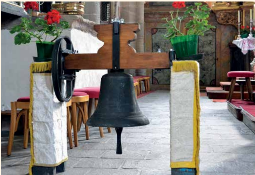
Die neue Glocke der Peterskirche