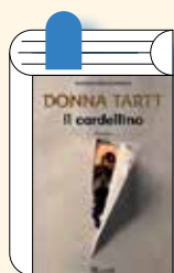
Il cardellino DONNA TARTT

Figlio di una madre devota e di un padre inaffidabile, Theo Decker sopravvive, appena tredicenne, all'attentato terroristico che in un istante manda in pezzi la sua vita. Solo a New-York, senza parenti né un posto dove stare, viene accolto dalla ricca famiglia di un suo compagno di scuola.