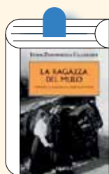
La ragazza del mulo ITALO Z. CALLEGHER

Figlio di una madre devota e di un padre inaffidabile, Theo Decker sopravvive, appena tredicenne, all'attentato terroristico che in un istante manda in pezzi la sua vita. Solo a New-York, senza parenti né un posto dove stare, viene accolto dalla ricca famiglia di un suo compagno di scuola.