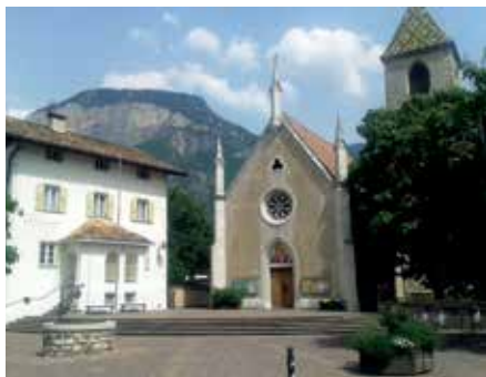
Der Martinsplatz in Kurtinig ist heuer Schauplatz der Freilichtspiele Unterland

Vom 18. August (Premiere) bis zum 5. September spielen die Freilichtspiele Unterland das Stück Glaube und Heimat , diesmal im südlichsten Teil des Unterlandes, der Gemeinde Kurtinig. Dabei wird Geschichte lebendig: