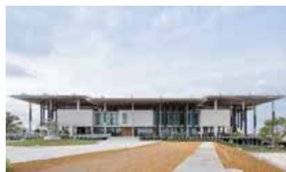
Pérez Art Museum Miami (PAMM)

Aperto per la prima volta nel 1993, progettato dall'architetto messicano Pedro Ramírez Vázquez in collaborazione con l'architetto svizzero Jean-Pierre Cahen, il museo doveva incarnare tre temi fondamentali: la cultura, la sua diffusione e la sua condivisione. Sette anni fa il comitato olimpico ha dato il suo benestare alla chiusura del museo per iniziare il restauro, pubblicando la carta bianca , un documento che contiene la bellezza di circa 300 idee che illustravano il possibile futuro del museo. Quattro gruppi di lavoro di esperti e artisti si sono prodigati questi anni per la ricostruzione della famosa istituzione svizzera: Francis Gabet, direttore del museo con i suoi collaboratori, i famosi architetti svizzeri Brauen & Wälchli, l'agenzia di comunicazione inglese Metaphor e l'architetto paesaggista svizzero Jean-Yves Le Baron. All'interno e all'esterno del Museo sono tante le novità che attendono i visitatori, svariate opere di artisti contemporanei come Botero, Igor Mitoraj ed Edoardo Chillida.