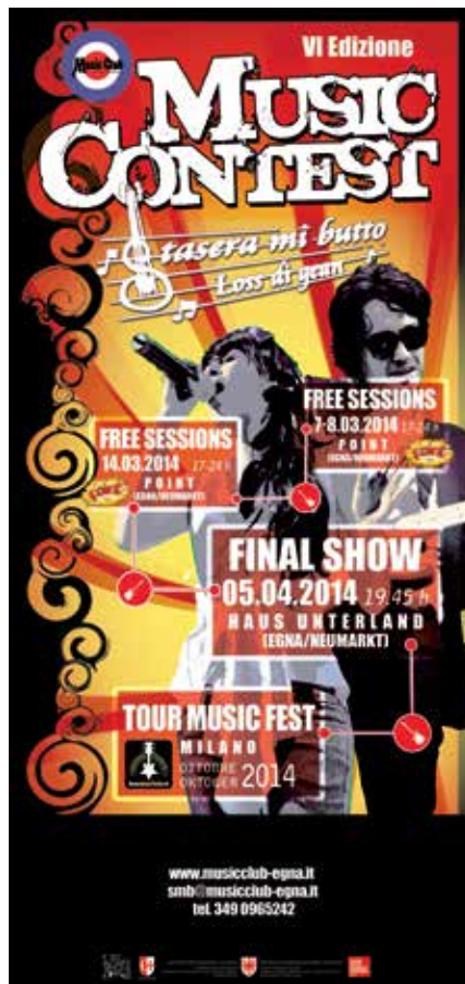
ARCHIV KVV - JUGEND AUER