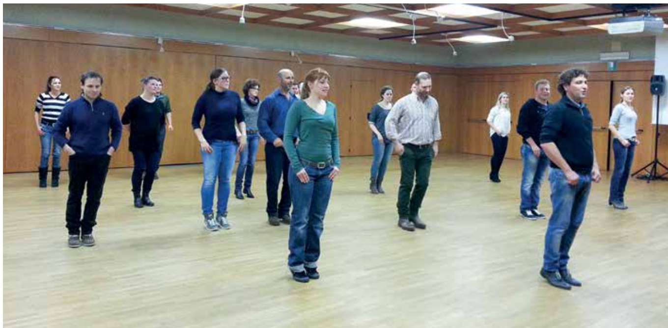
Fleißig geübt beim Tanzkurs im Haus der Vereine