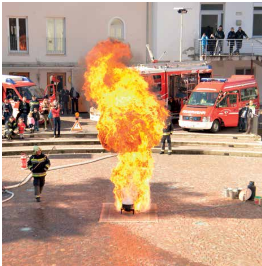
Die Freiwillige Feuerwehr probte für den Ernstfall beim letztjährigen Dorffest