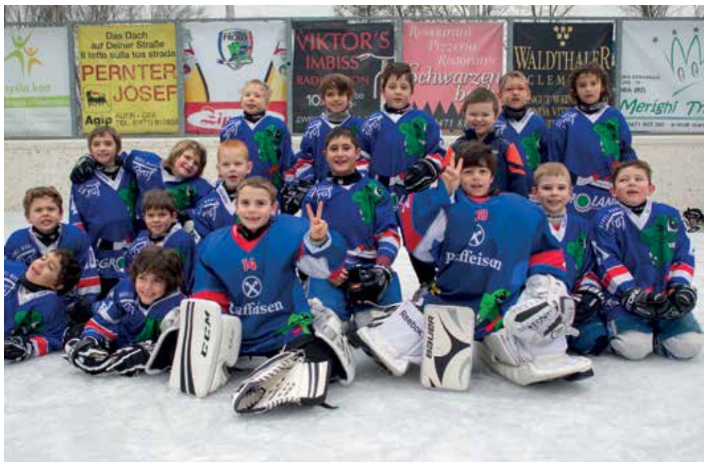
Die Kleinsten beim Under 8 Turnier in Auer