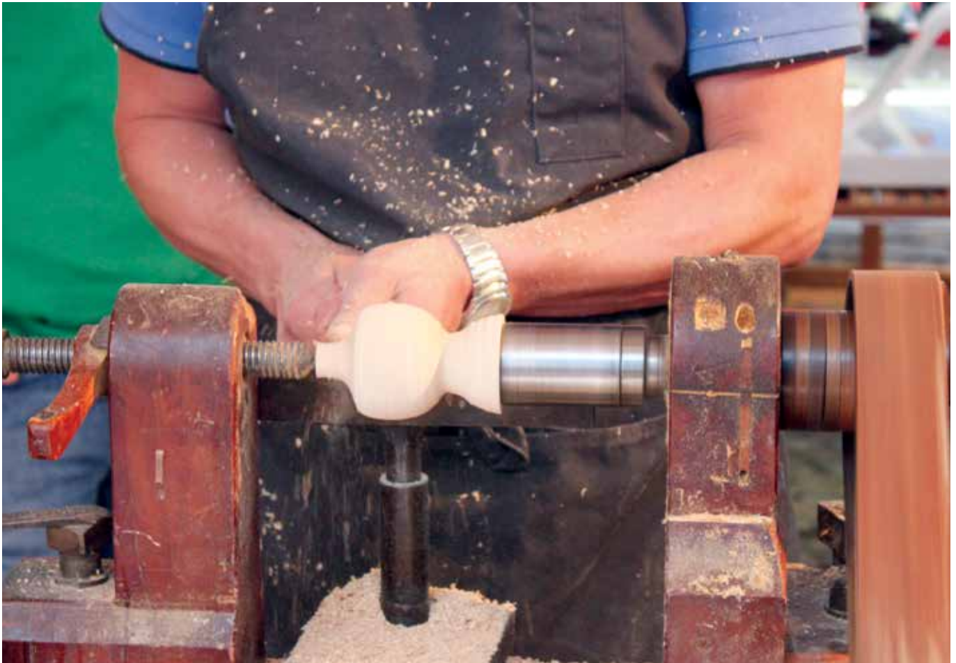
Verschiedene Handwerksberufe werden in den Neumarkter Lauben vorgestellt

2014 laden die Unterlandler Handwerker am Wochenende des 17. und 18. Mai wieder zum Staunen, Schauen und Probieren nach Neumarkt ein. Jetzt anmelden! Noch letzte Ausstellungsflächen zu vergeben.