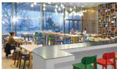
TOM Café im Olympischen Museum

Ersteröffnet wurde das Museum im Jahre 1993, geplant vom mexikanischen Architekt Pedro Ramírez Vázquez in Zusammenarbeit mit dem Schweizer Jean-Pierre Cahen mit dem Grundgedanken drei Aspekte zu verkörpern: Kultur, dessen Verbreitung und Bildung. Vor sieben Jahren entschied das Olympische Komitee das Museum komplett zu renovieren. Es veröffentlichte das sogenannte White Paper , ein 107-seitiges Dokument mit rund 300 Ideen für die Zukunft des Museums. Auf dessen Basis arbeiteten vier Arbeitsgruppen von Experten und Kreativen am neuen Erscheinungsbild des Museums: Francis Gabet, der Direktor des Olympischen Museums und seine Mitarbeiter, die Schweizer Architekten Brauen & Wälchli, die britische Kommunikationsfirma Metaphor und der Schweizer Landschaftsarchitekt Jean-Yves Le Baron. Sei es im Ausstellungsbereich als auch in den Außenbereichen des Museums erwarten die Besucher viele Neuigkeiten sowie mehrere Werke von zeitgenössischen Künstlern wie Botero, Igor Mitoraj und Edward Chillida.