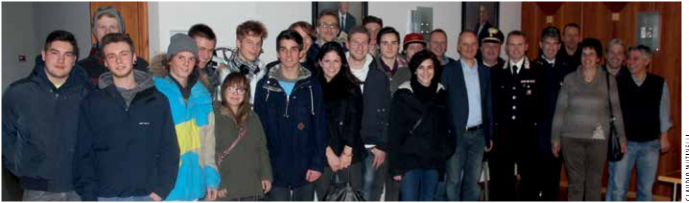
Die JungbürgerInnen des Jahrgangs 1995 aus Auer